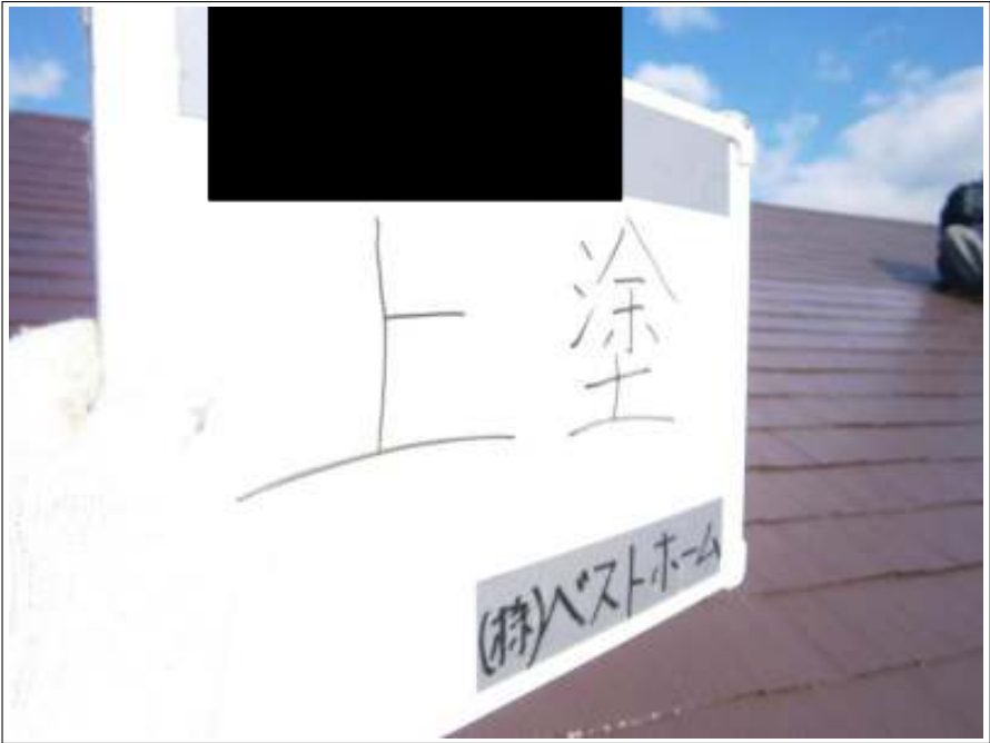
屋根上塗り施工状況