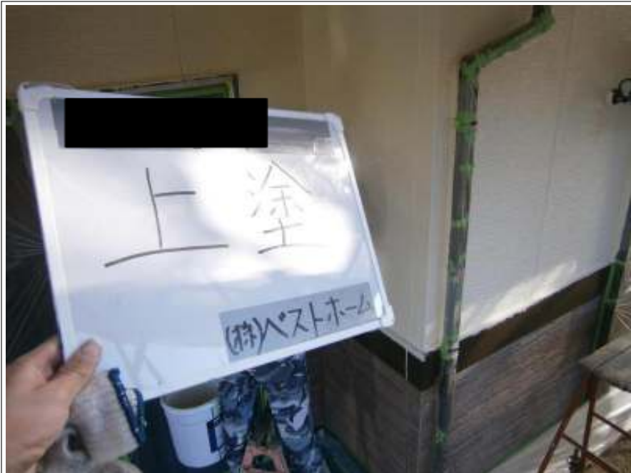
外壁上塗り施工状況