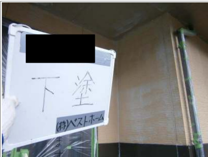
外壁下塗り施工中