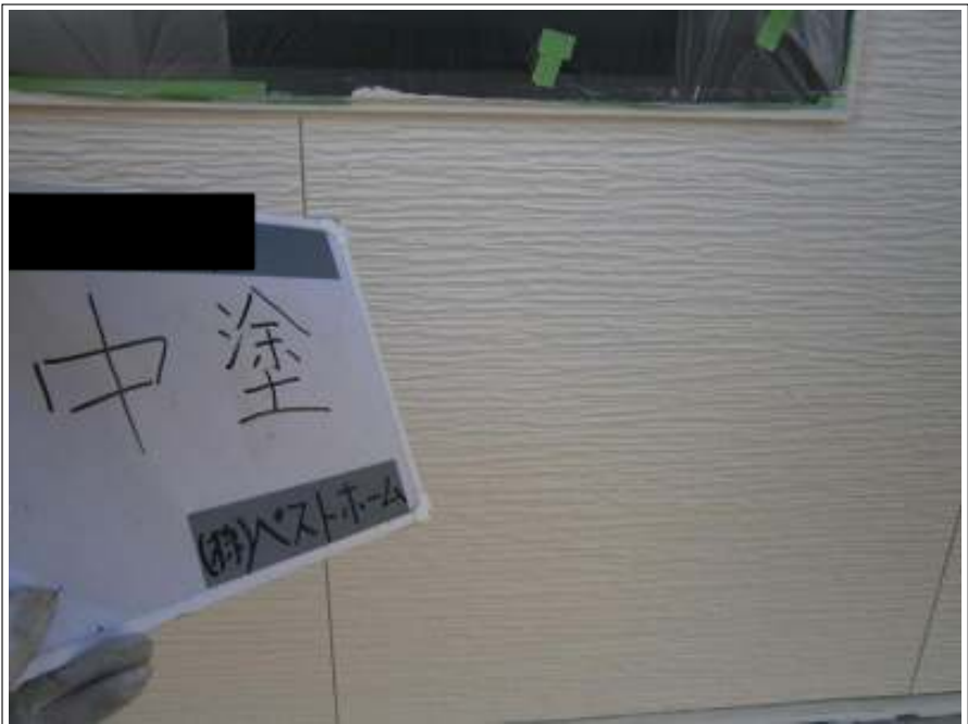
外壁中塗り施工完了