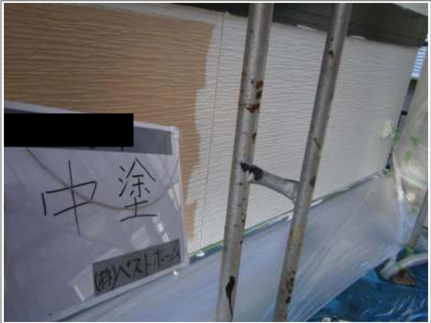
外壁中塗り施工中