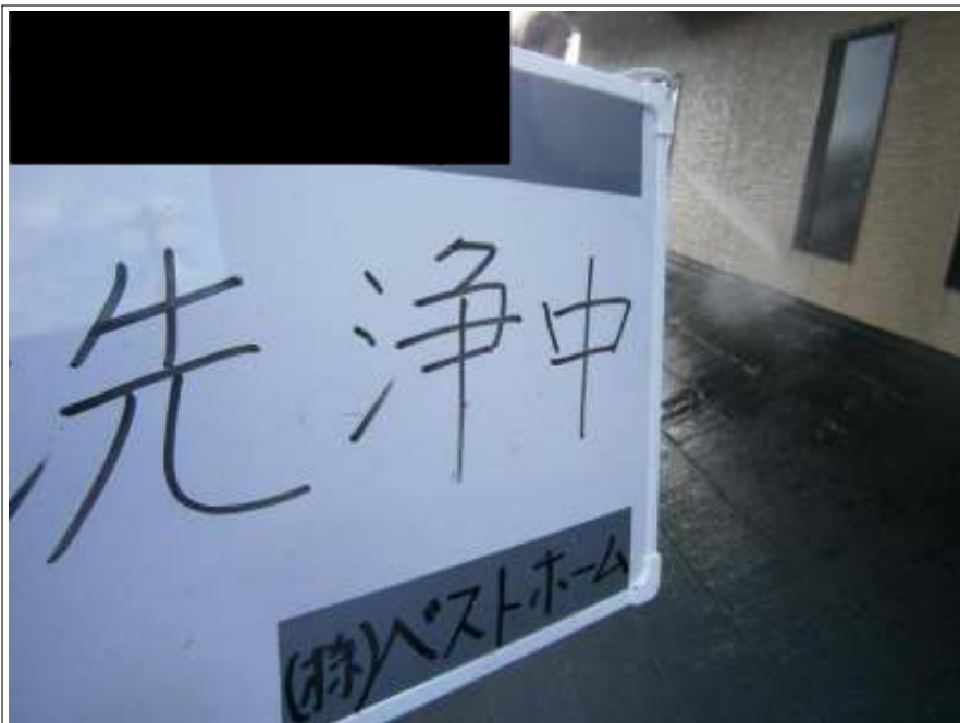
外壁高圧洗浄施工状況