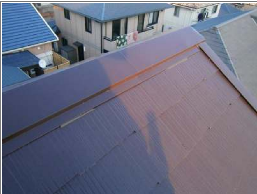
ラバー止め施工完了