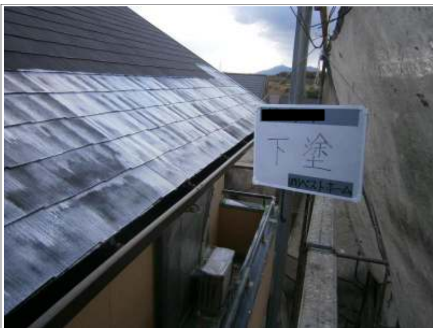
屋根下塗り施工状況