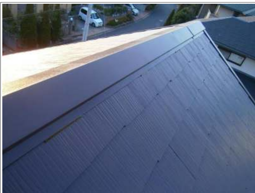
ラバー止め施工完了