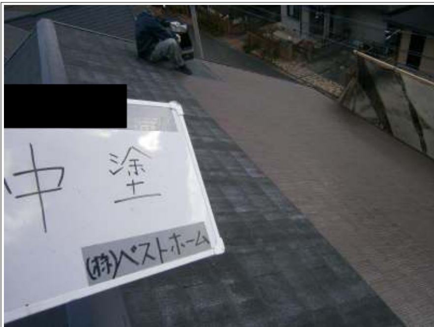
屋根中塗り施工中