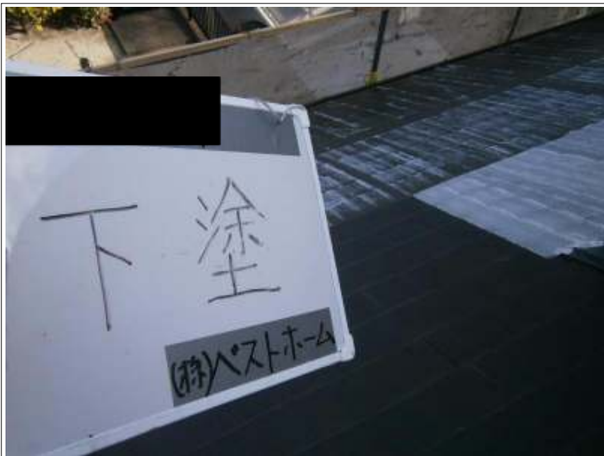
屋根下塗り施工中