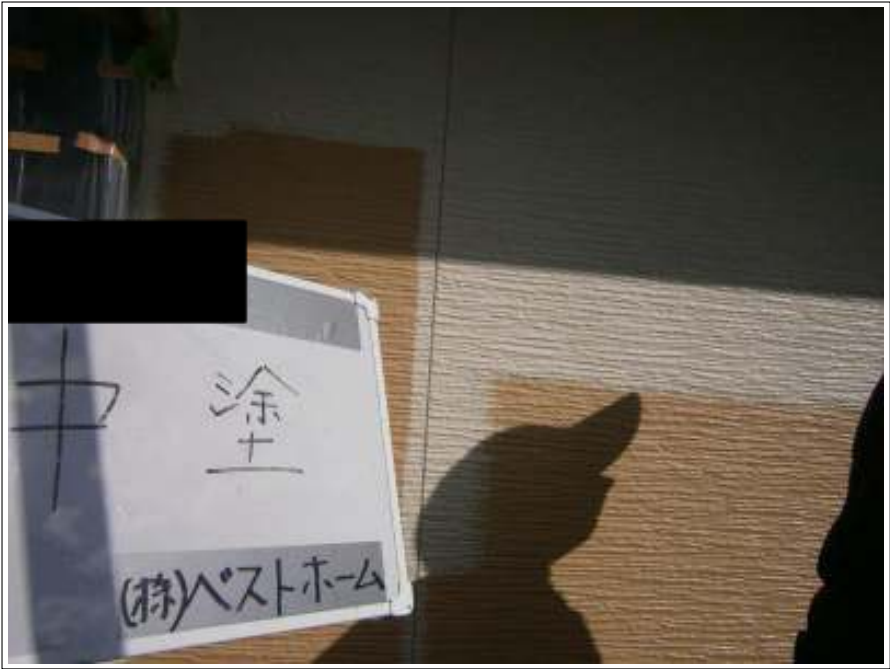
外壁中塗り施工状況