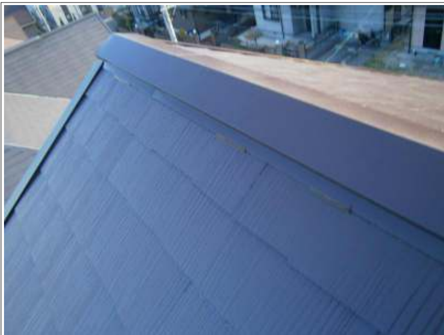
ラバー止め施工完了