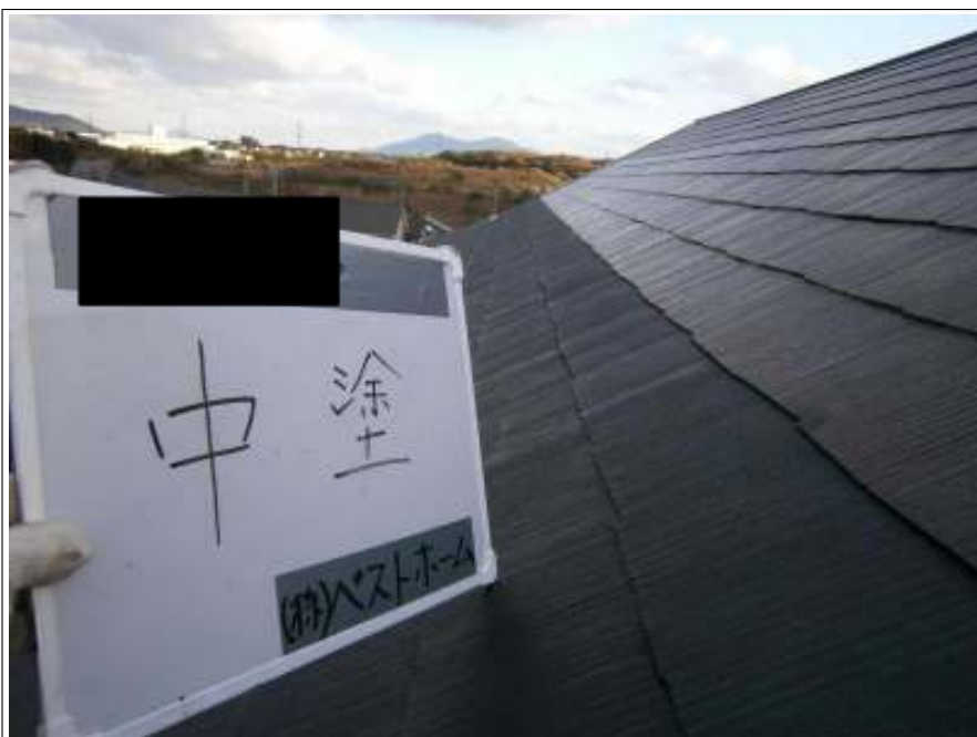
屋根中塗り施工中