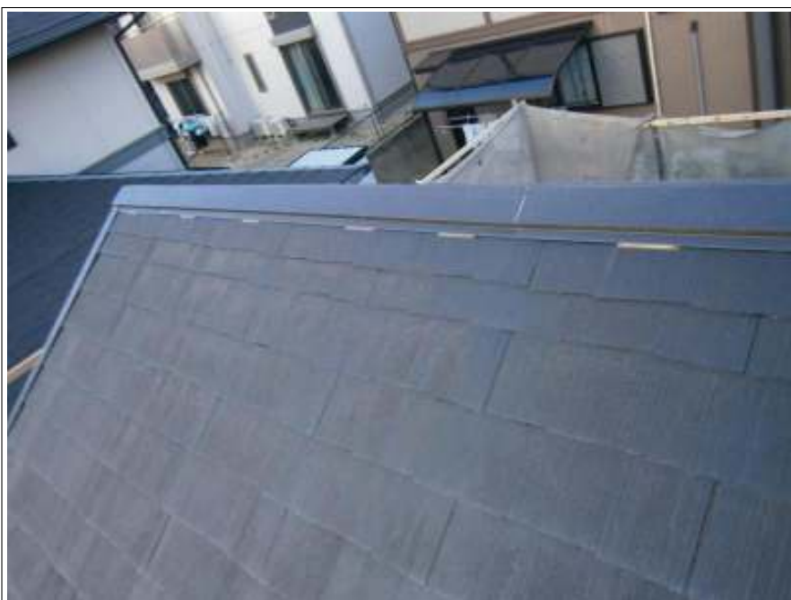
ラバー止め施工完了