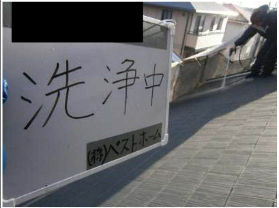
屋根高圧洗浄施工中