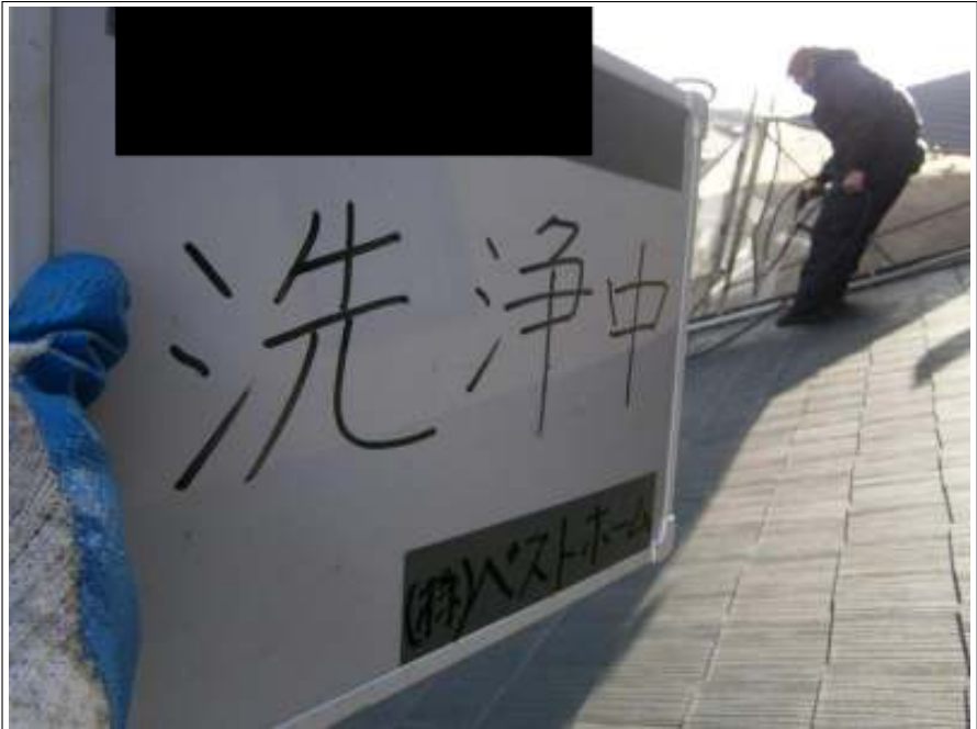
屋根高圧洗浄施工状況