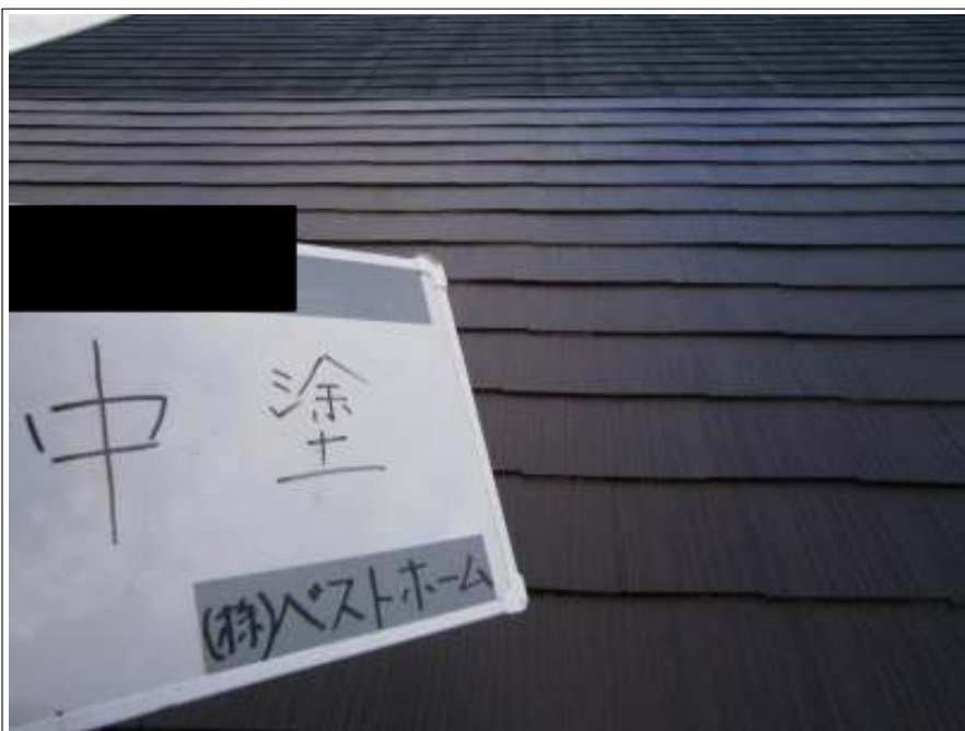
屋根中塗り施工状況