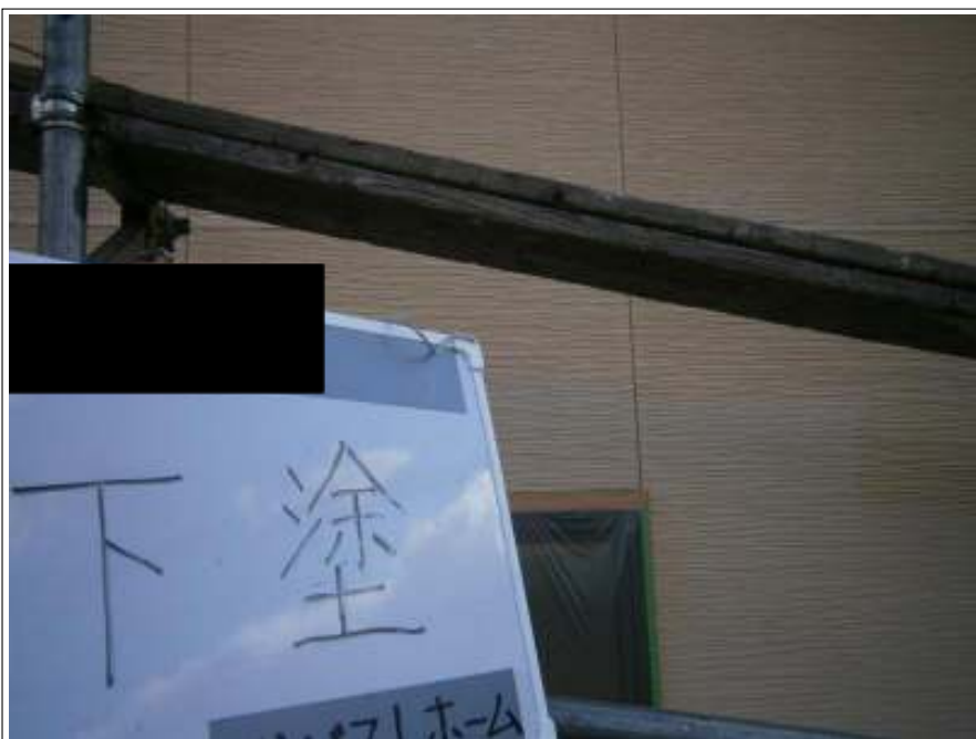
外壁下塗り施工状況