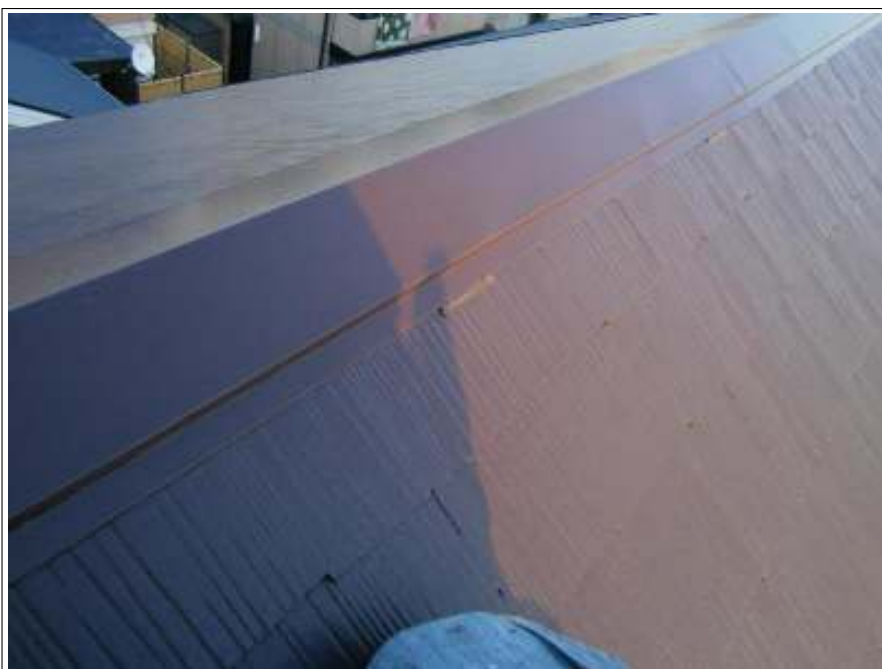
ラバー止め施工完了