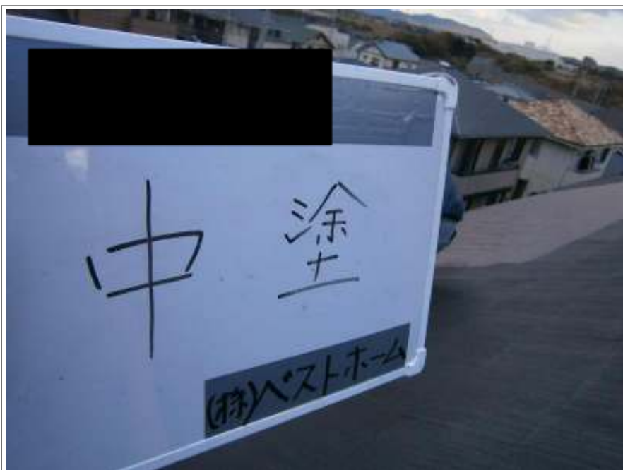
屋根中塗り施工中