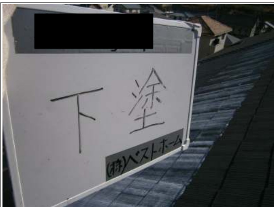
屋根下塗り施工中