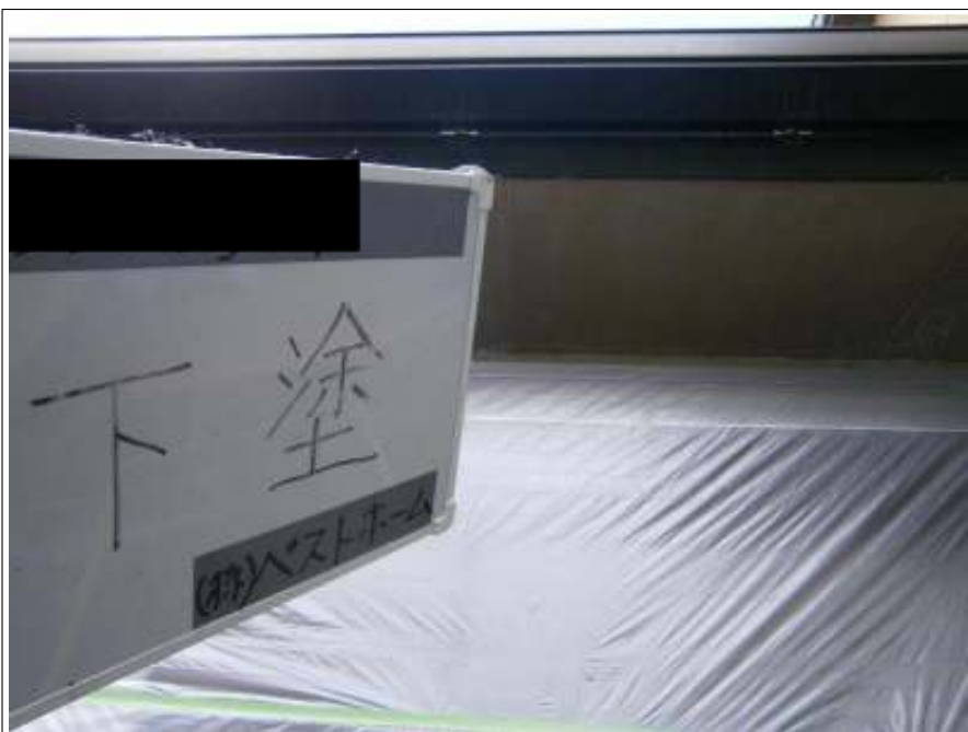
外壁下塗り施工中