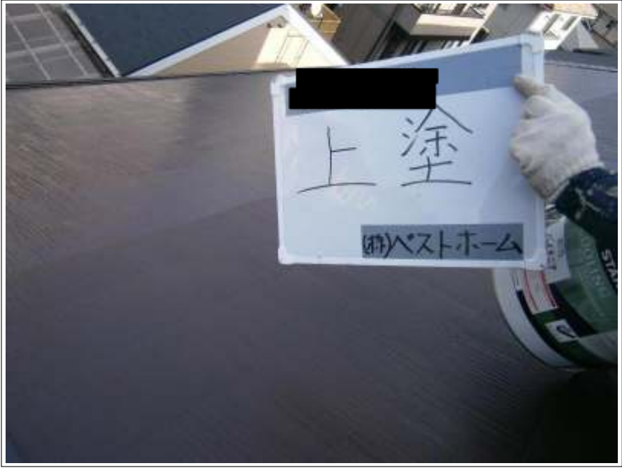
屋根上塗り施工中