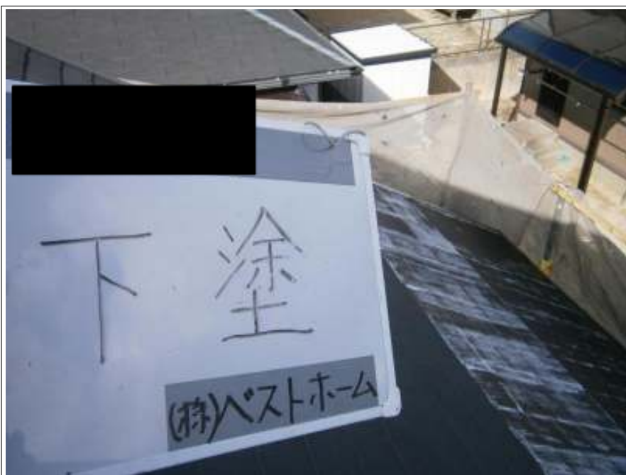
屋根下塗り施工中