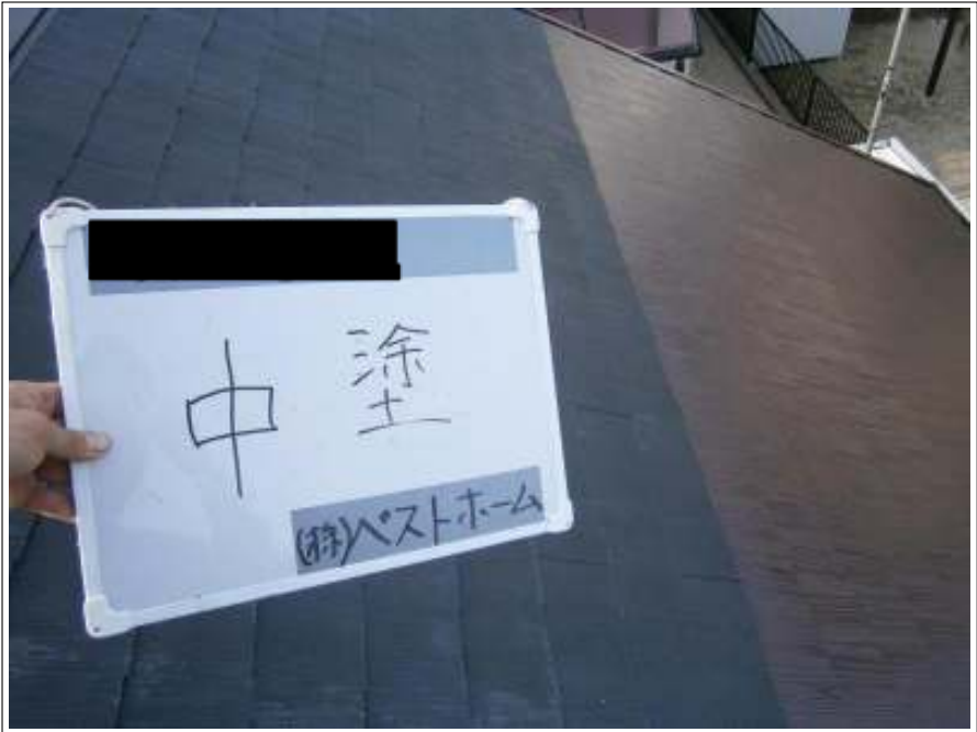
屋根中塗り施工中