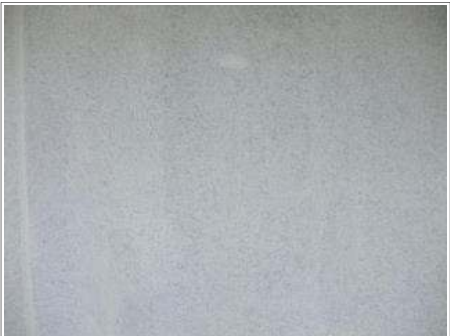
外壁塗装下塗り施工完了