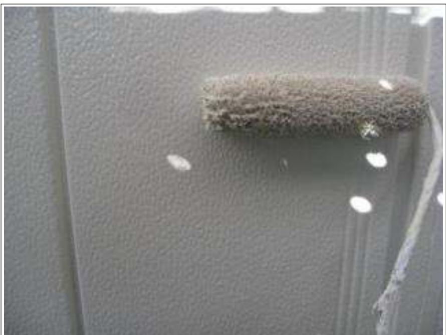
雨戸塗装上塗り施工中