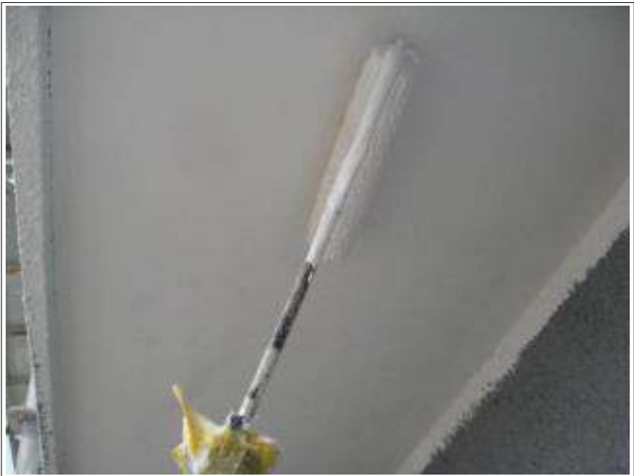
軒天塗装下塗り施工中