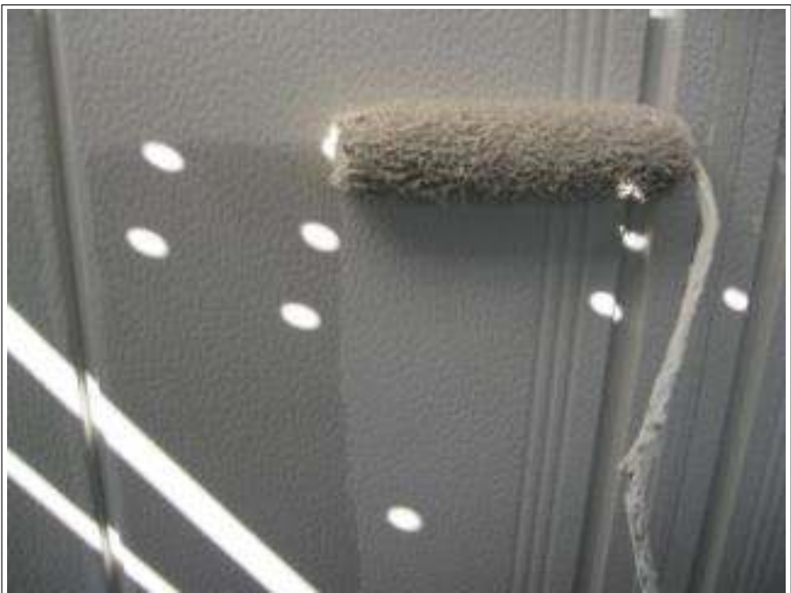
雨戸塗装下塗り施工中