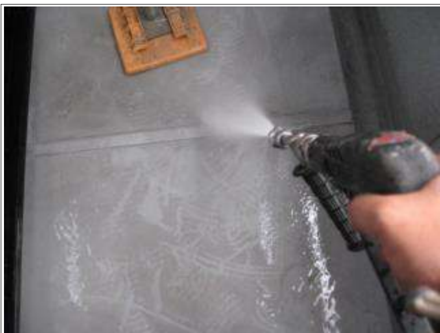
バルコニー床高圧洗浄施工中