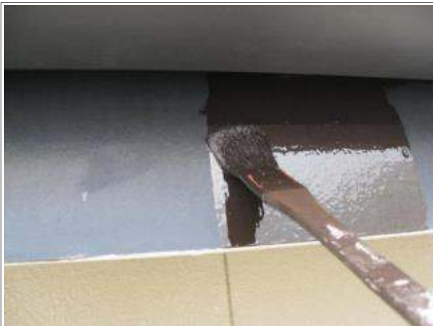
破風板塗装下塗り施工中