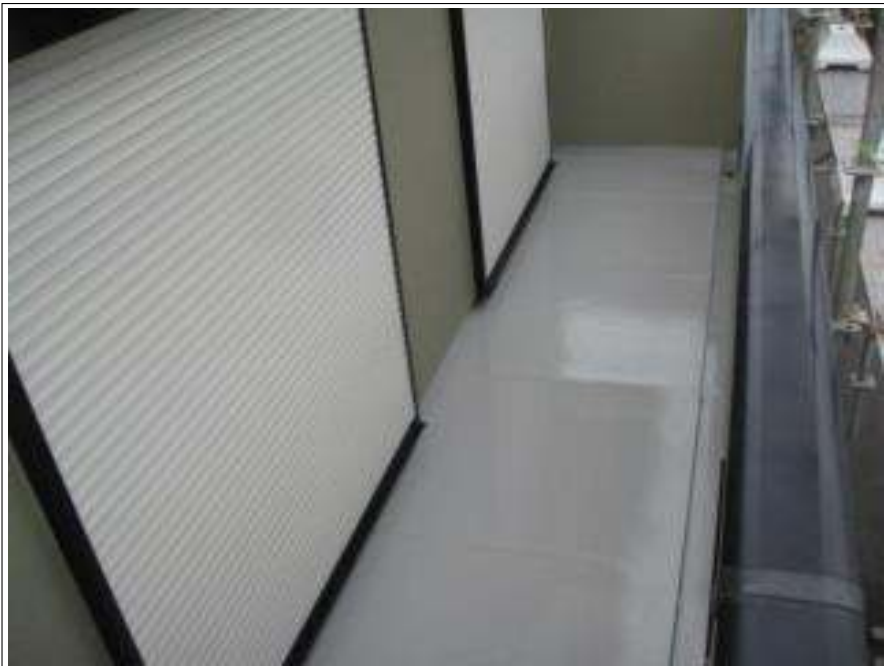
バルコニー床塗装施工完了