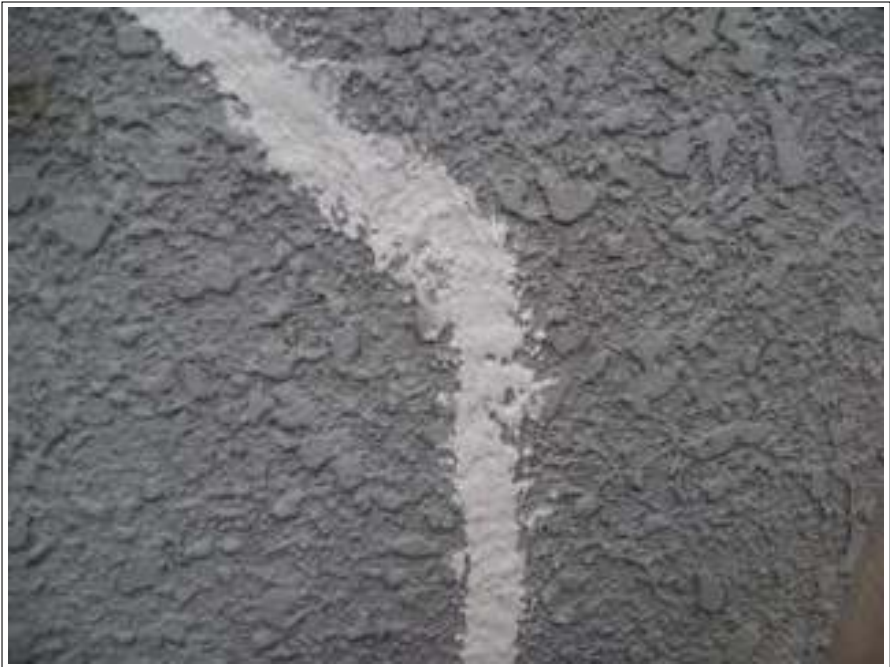
外壁クラック補修施工完了