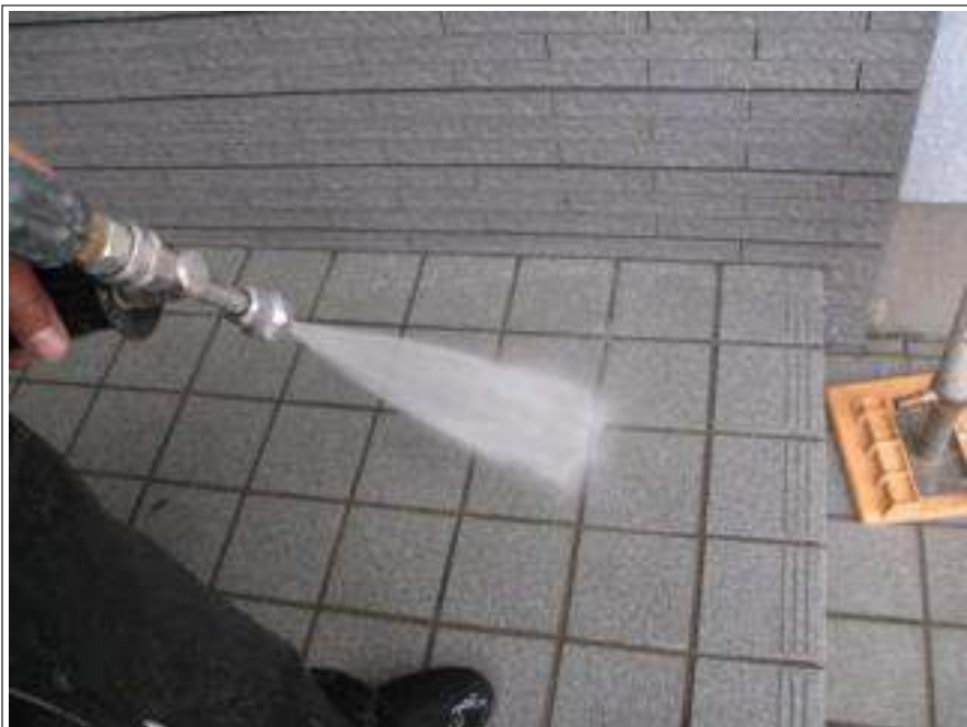
玄関土間タイル高圧洗浄施工中