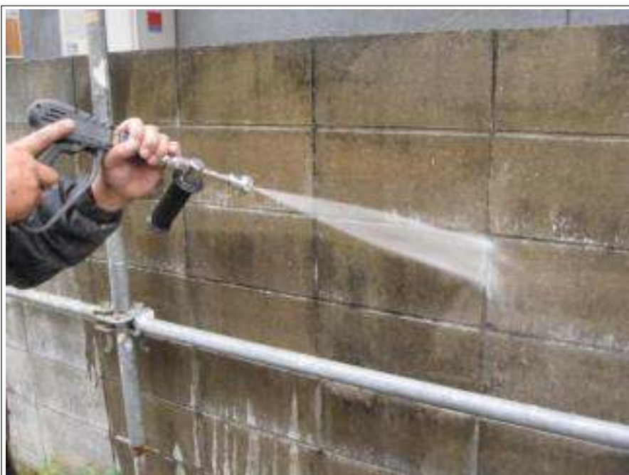
塀高圧洗浄施工中