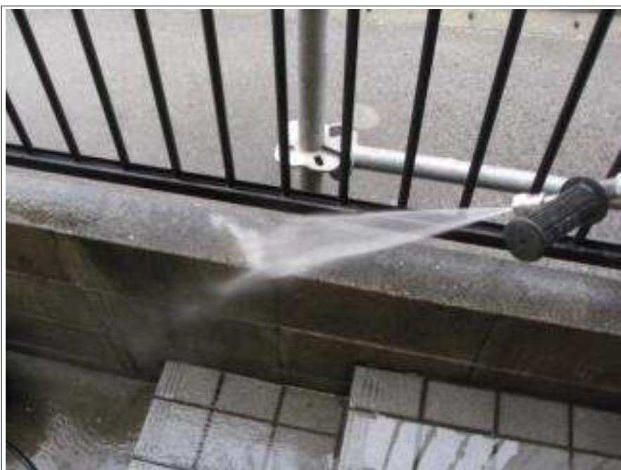
塀高圧洗浄施工中