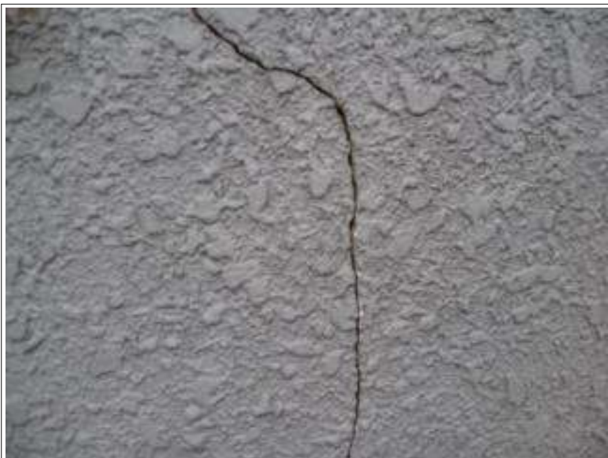
外壁クラック補修施工前