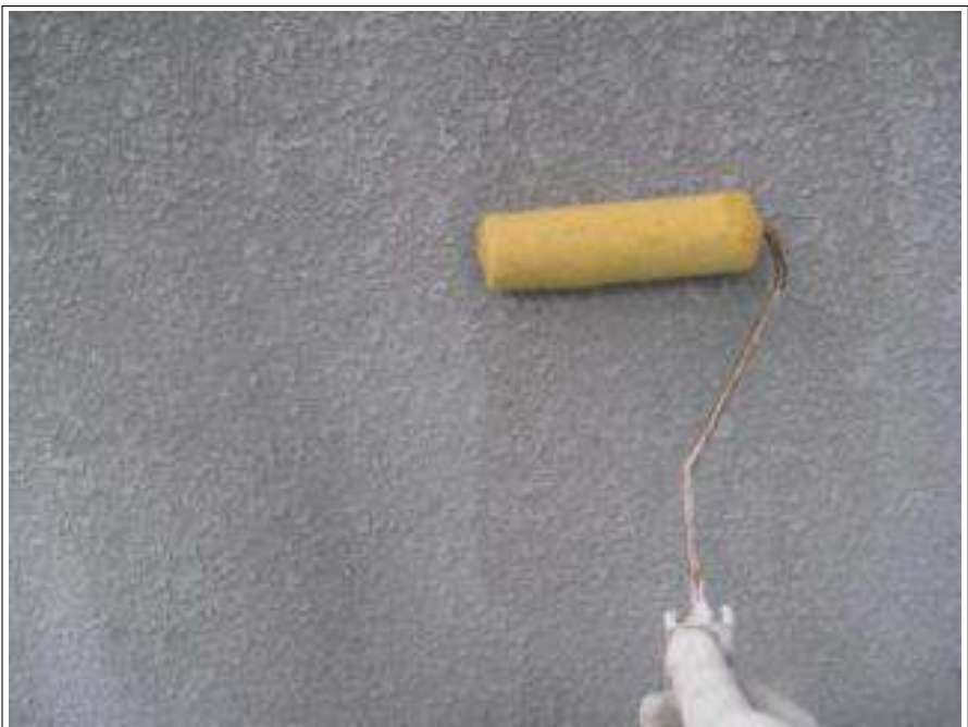
外壁バリアー施工中