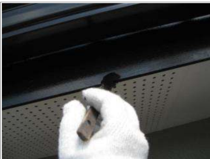
破風板塗装上塗り施工中