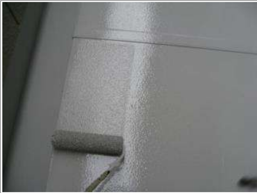
バルコニー床塗装上塗り施工中