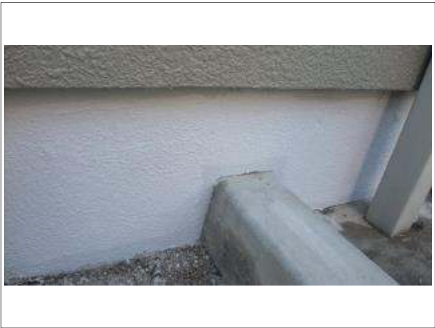
基礎ベースガード施工完了