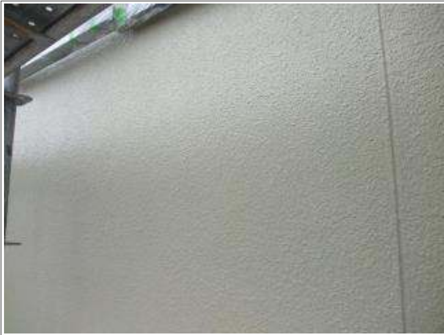
外壁塗装中塗り施工完了