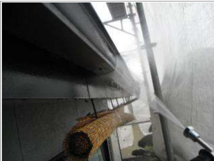
樋高圧洗浄施工中