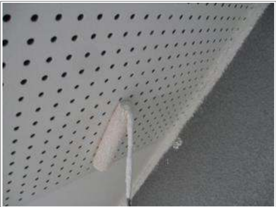
軒天塗装上塗り施工中