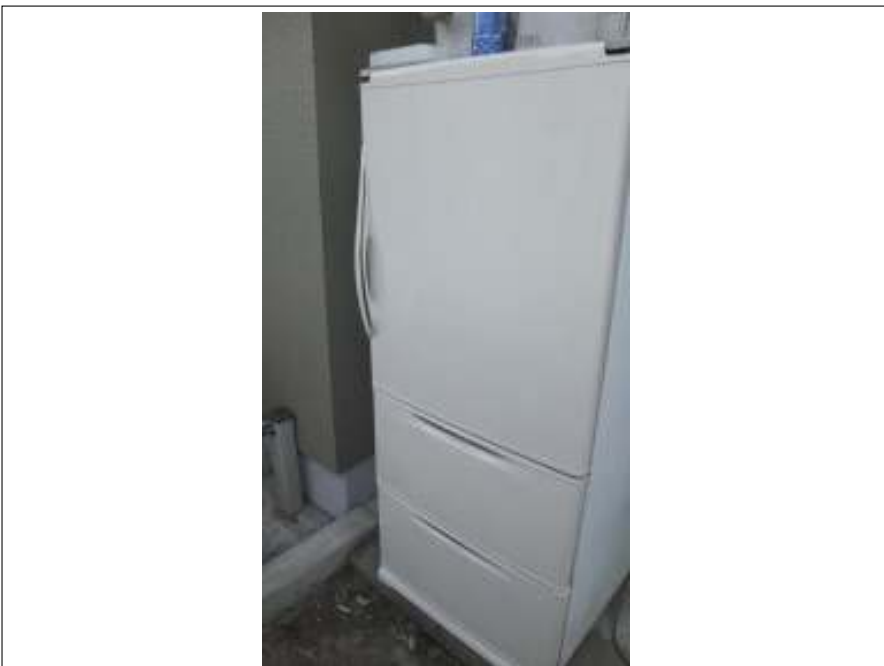
冷蔵庫表面塗装施工完了