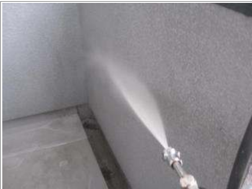
バルコニー高圧洗浄施工中