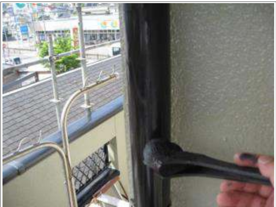
樋塗装上塗り施工中