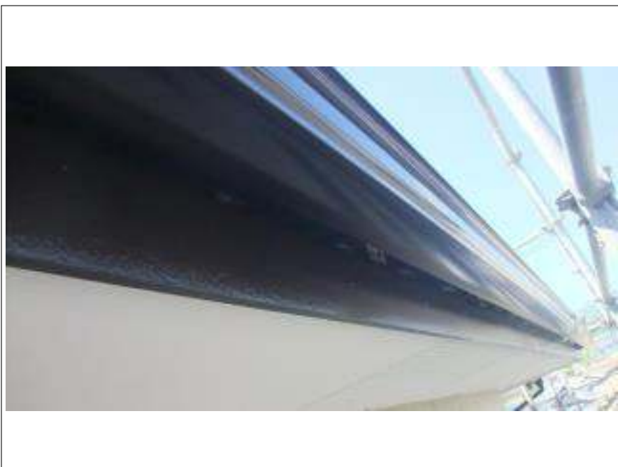
破風板塗装施工完了