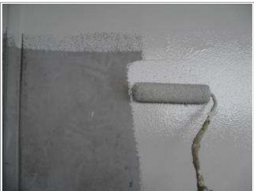
バルコニー床塗装下塗り施工中