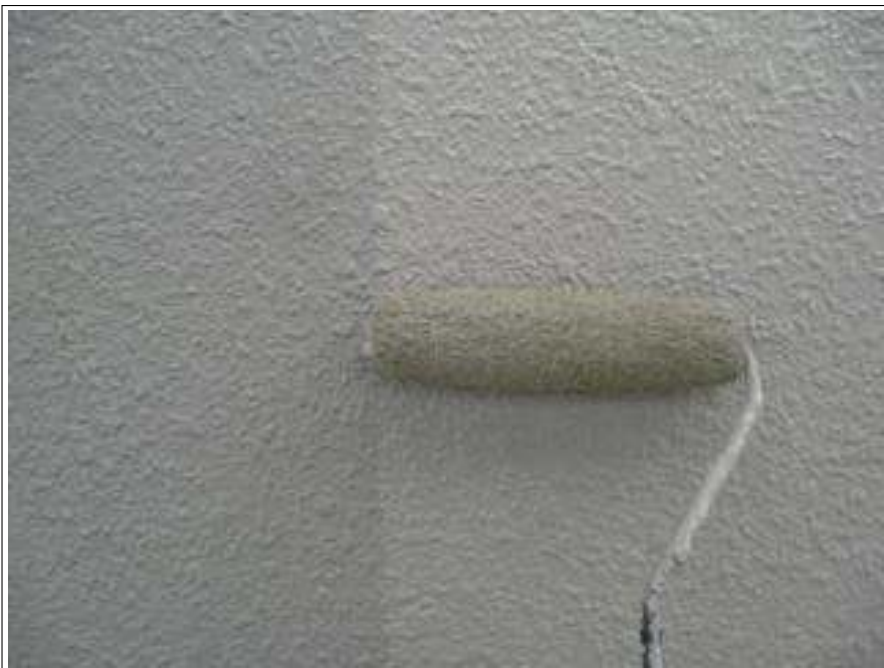
外壁塗装上塗り施工中