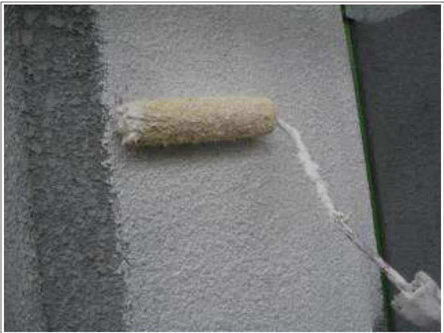
外壁塗装下塗り施工中