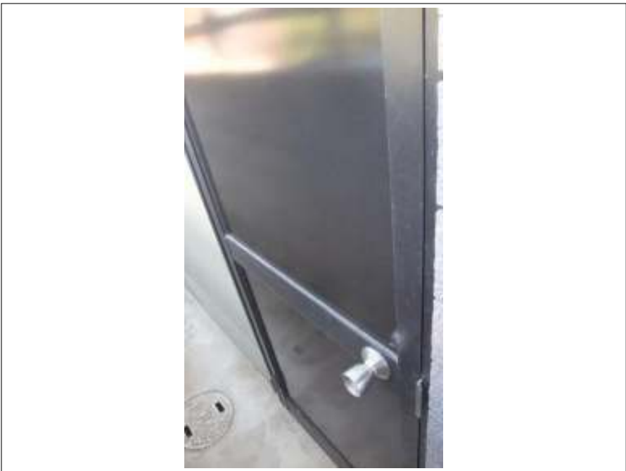
玄関横 勝手口塗装施工完了