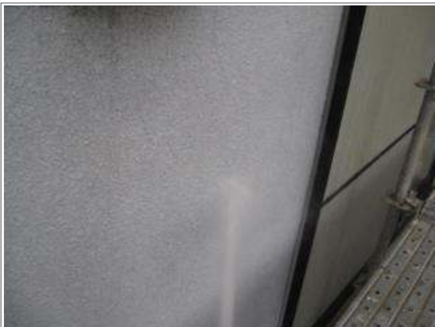
外壁高圧洗浄施工中