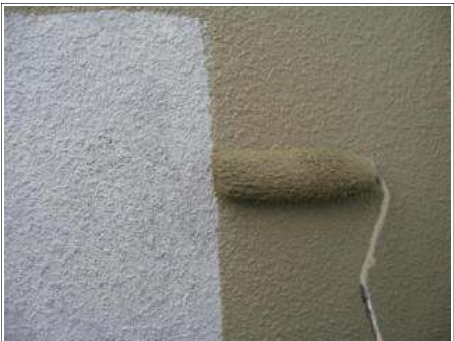
外壁塗装中塗り施工中