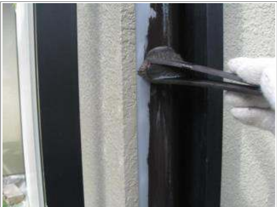
樋塗装下塗り施工中