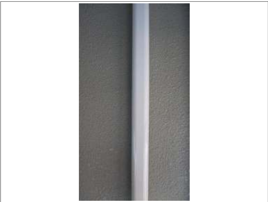
ダクトカバー塗装施工完了