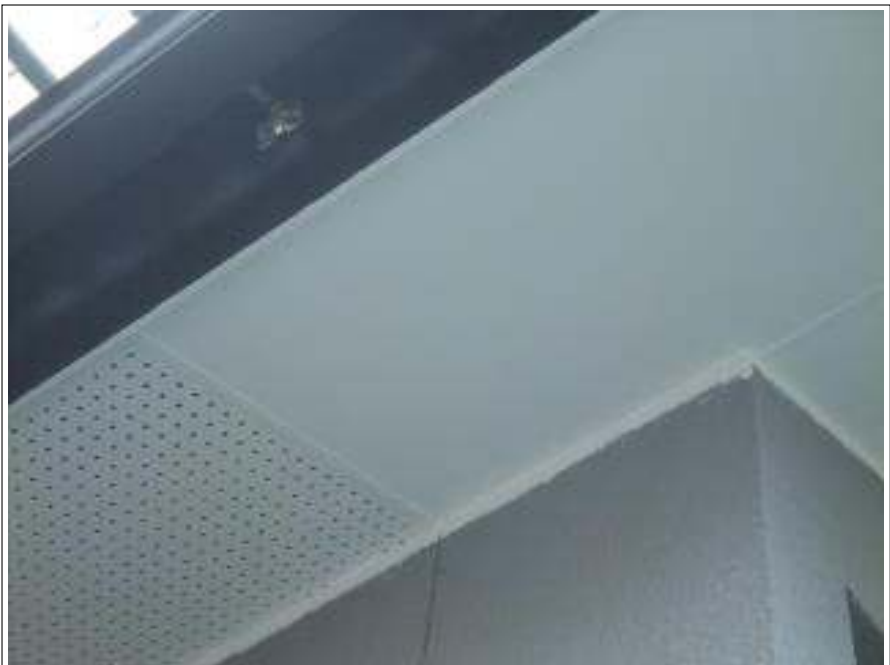
軒天塗装施工完了