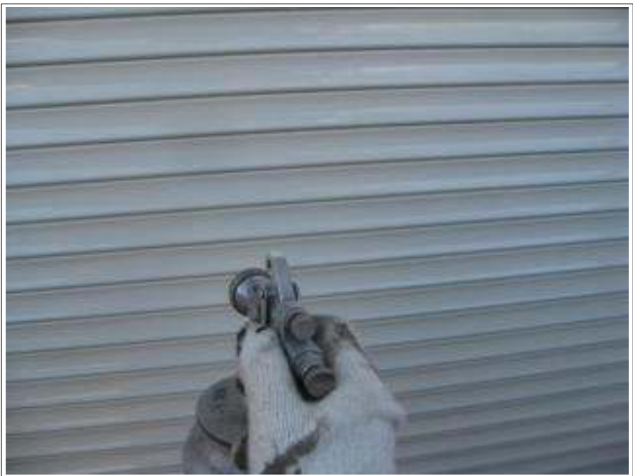
シャッター塗装施工中