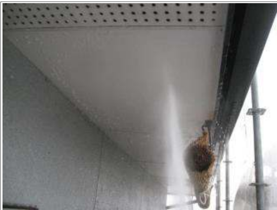
軒天高圧洗浄施工中