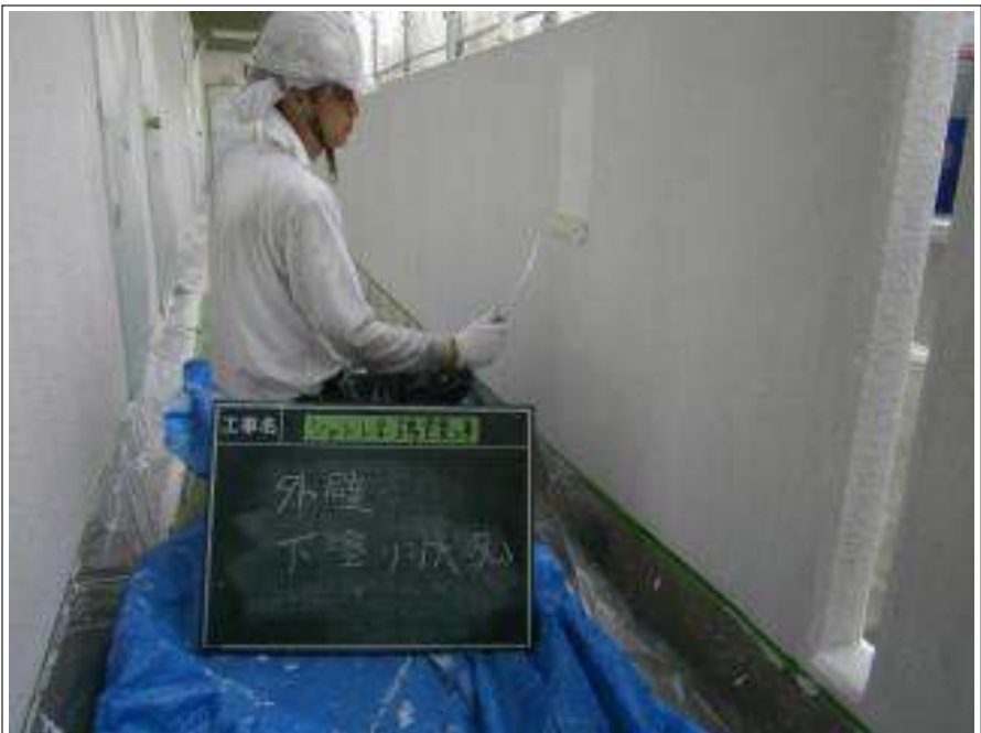
外壁 下塗り施工中