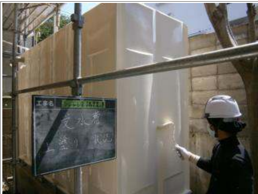
受水槽 上塗り施工中