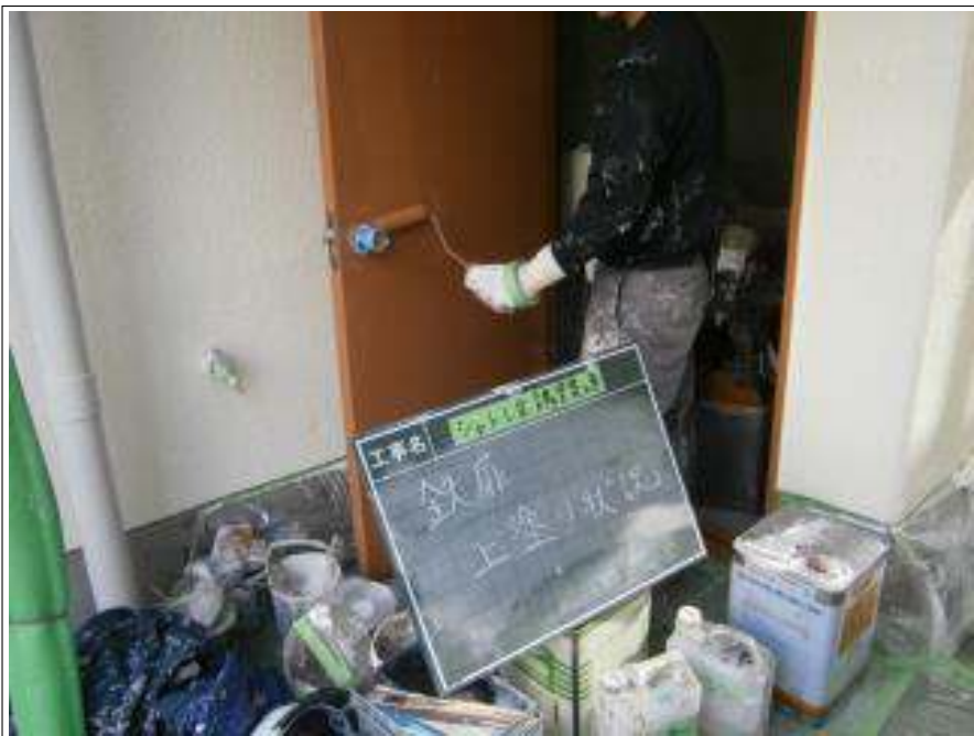
鉄扉 上塗り施工中