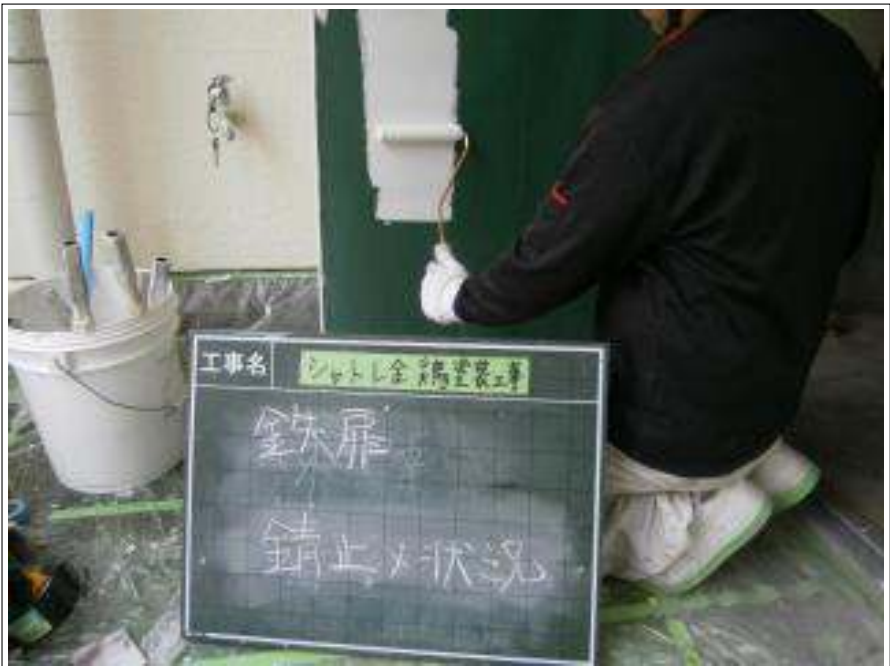
鉄扉 サビ止め施工中