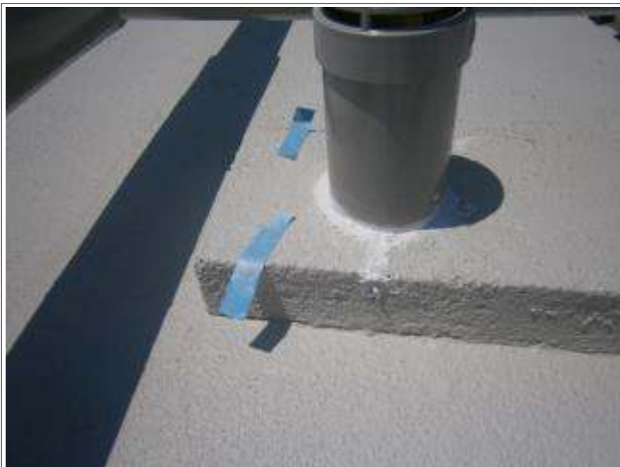
シーリング補修 施工中