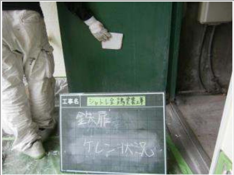
鉄扉 ケレン施工中