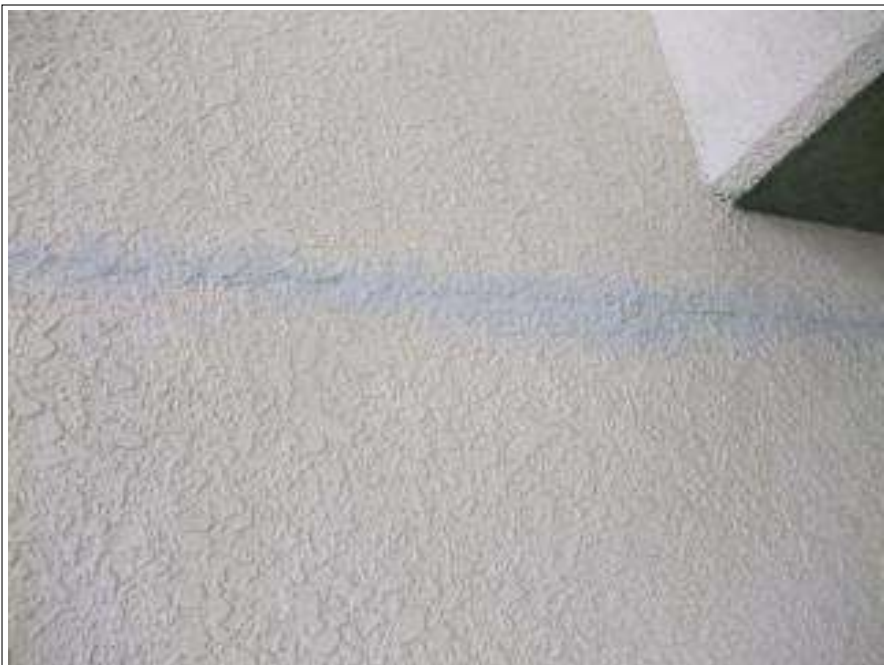
クラック補修 施工完了