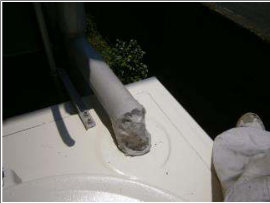
配管補修 施工完了