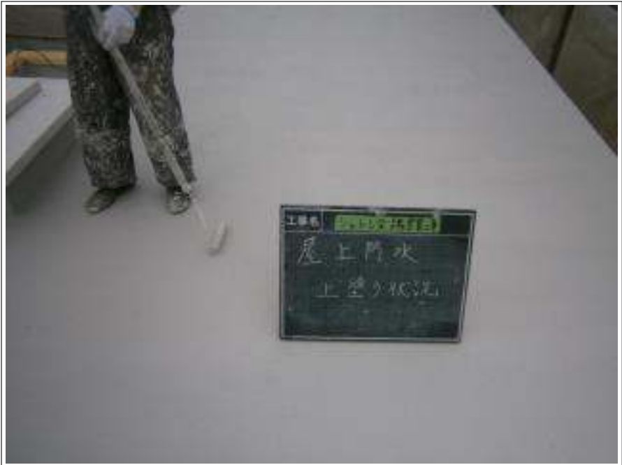
屋上 上塗り施工中