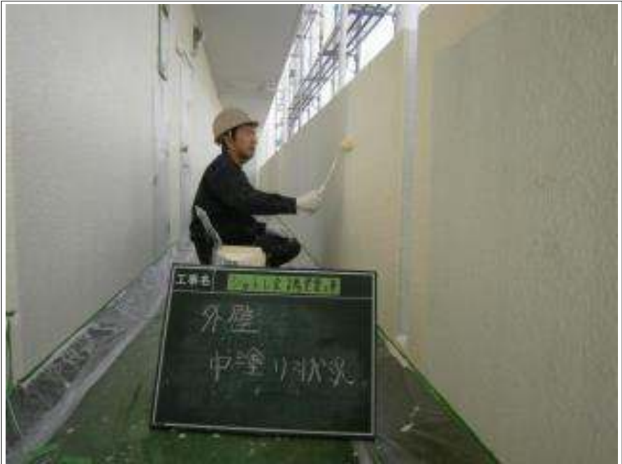
外壁 中塗り施工中