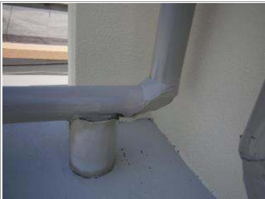
配管補修 施工完了