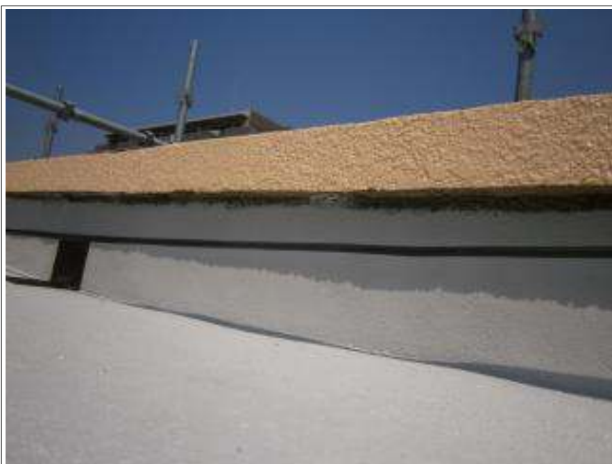
外壁(アクセント部) 施工完了