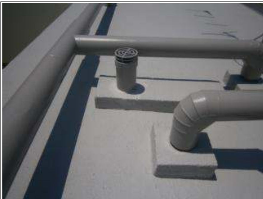
シーリング補修 施工中