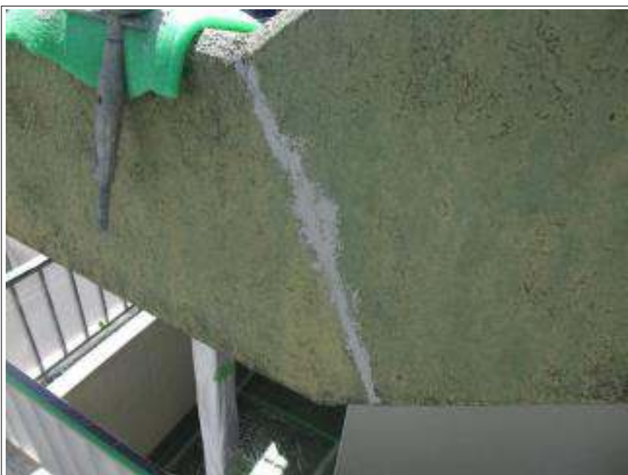
クラック補修 施工完了