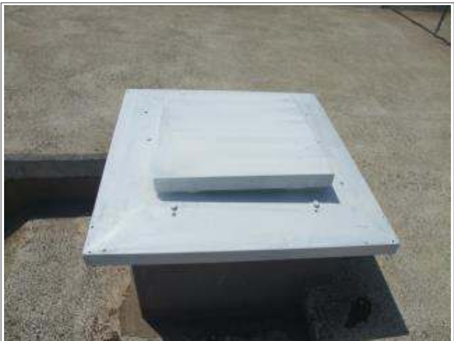
サビ止め施工完了