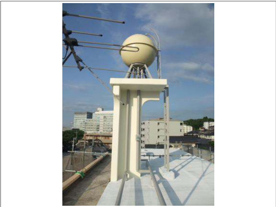
屋上受水槽 施工完了