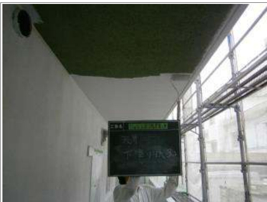
軒天 下塗り施工中