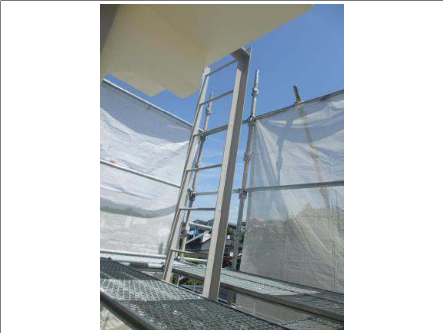
タラップ 塗装完了