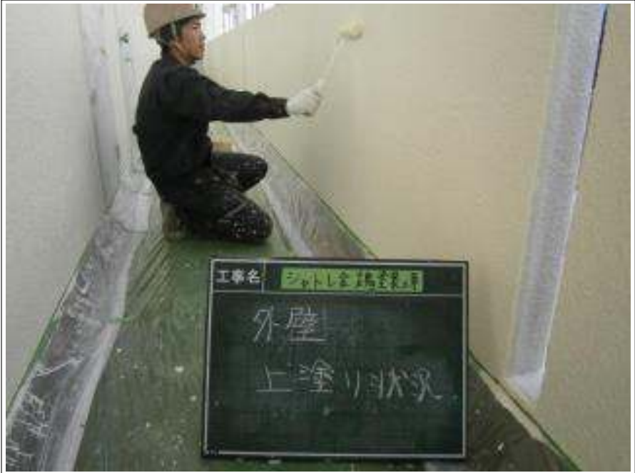
外壁 上塗り施工中