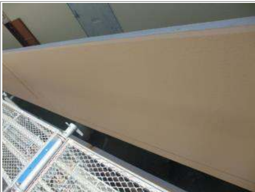
外壁(アクセント部) 施工完了