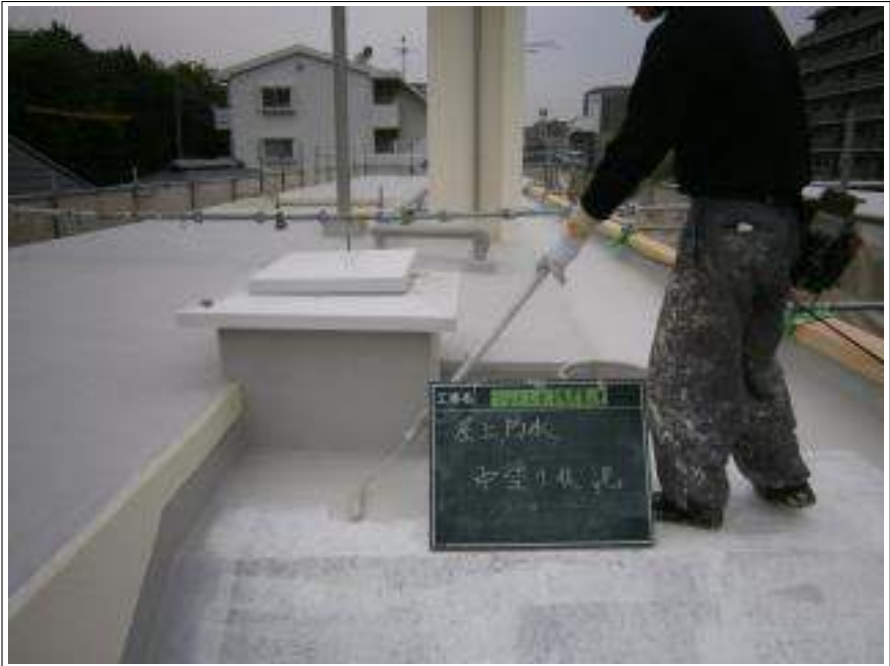
屋上 中塗り施工中