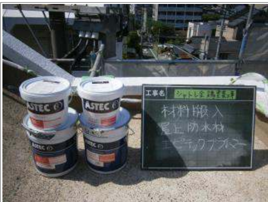
屋上 下塗り使用材料