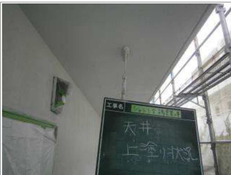
軒天 上塗り施工中