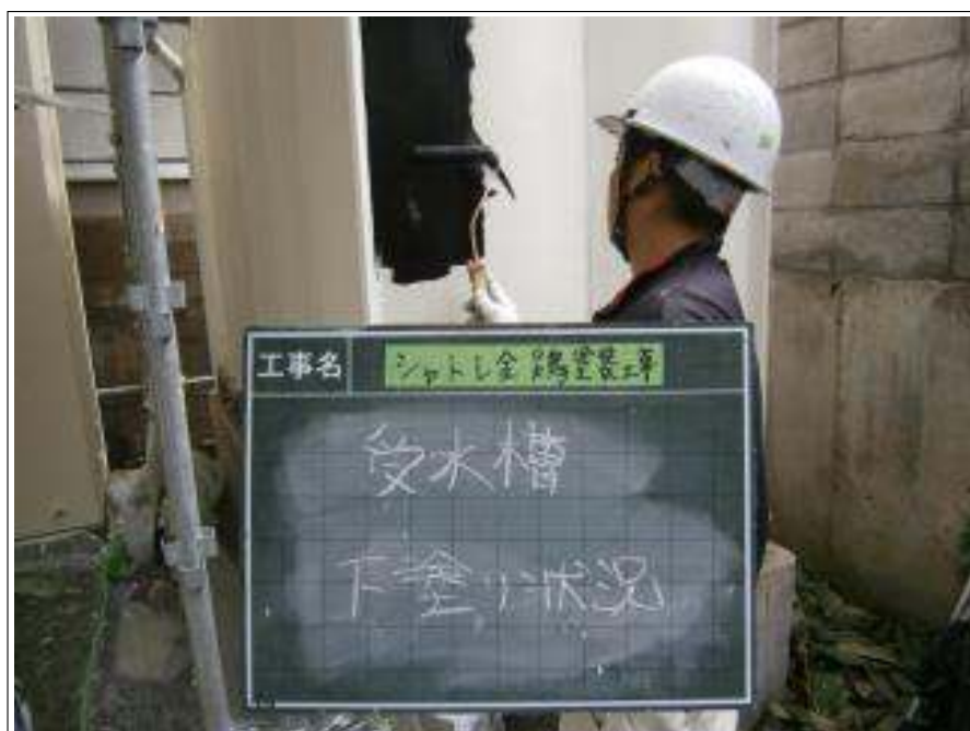
受水槽 下塗り施工中