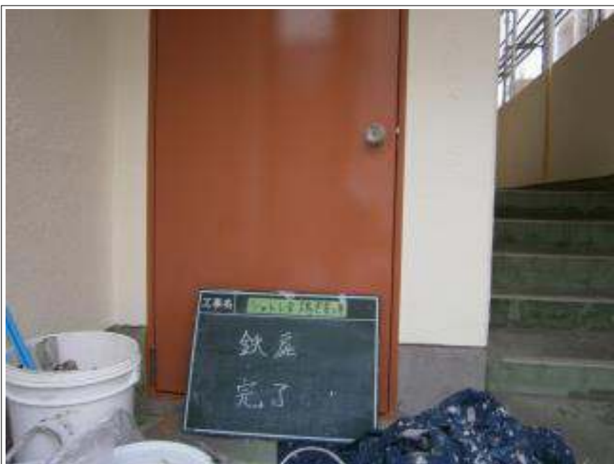
鉄部 扉 施工完了