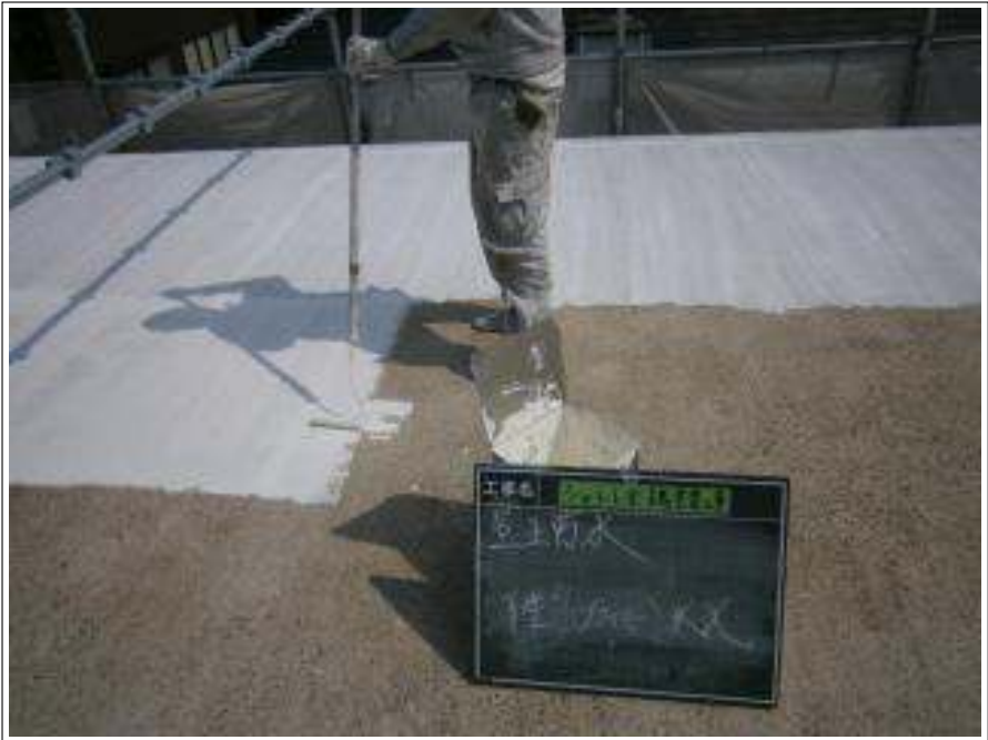
屋上 下塗り施工中