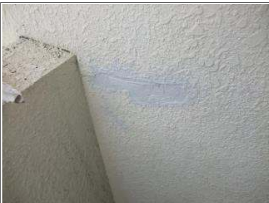
外壁 パテ補修施工完了