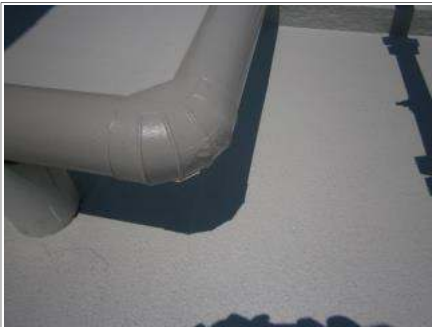
配管補修 施工完了