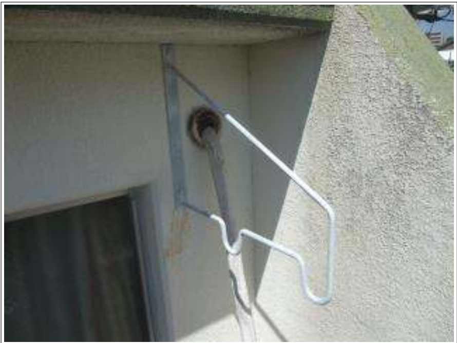
サビ止め施工完了