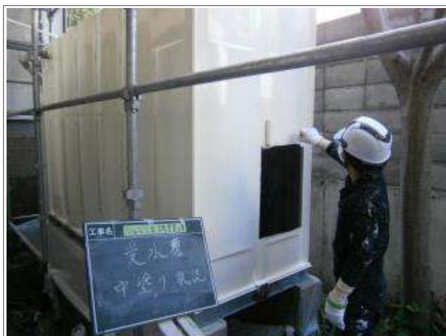
受水槽 中塗り施工中