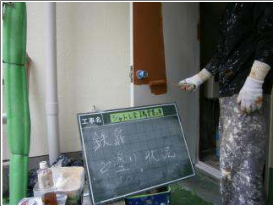
鉄扉 中塗り施工中