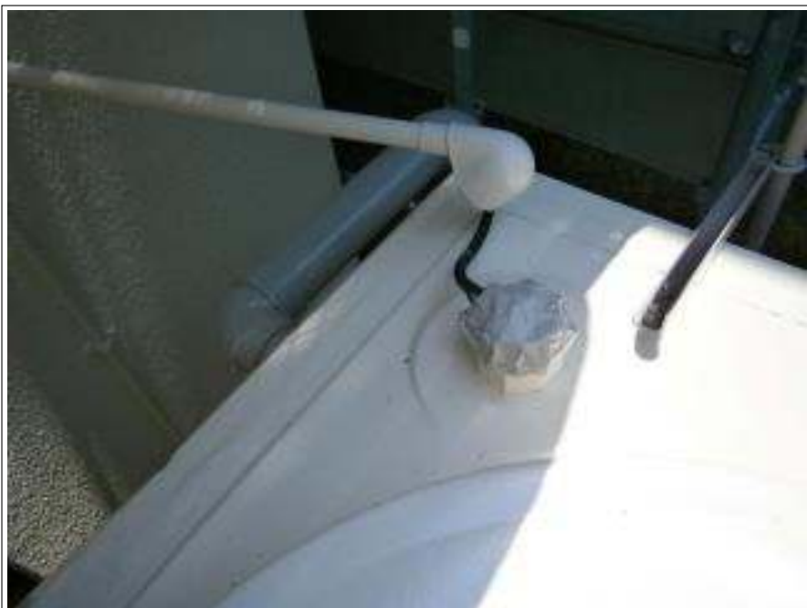
配管補修 施工完了