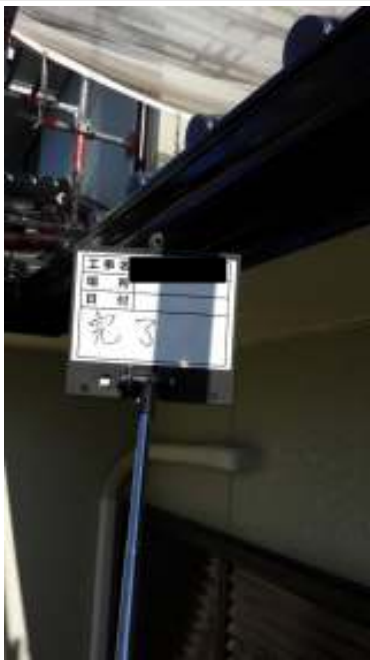
破風・樋 施工完了