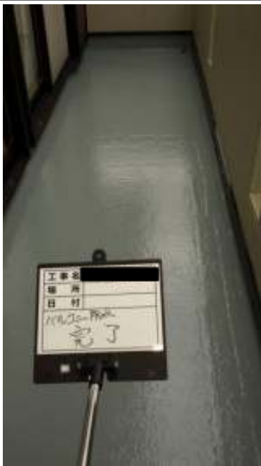
ベランダ防水 施工完了