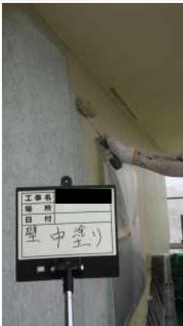
外壁 中塗り施工中