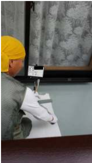
ベランダ防水 中塗り施工中