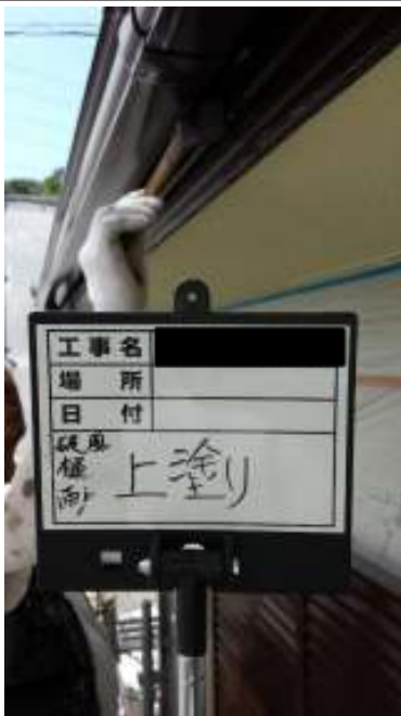
破風・樋 上塗り施工中