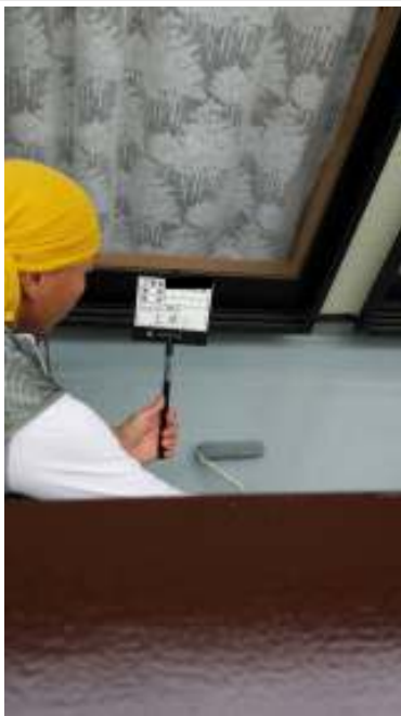
ベランダ防水 上塗り施工中