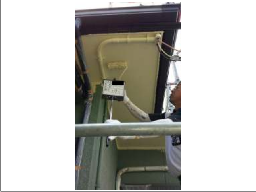
軒天 上塗り施工中