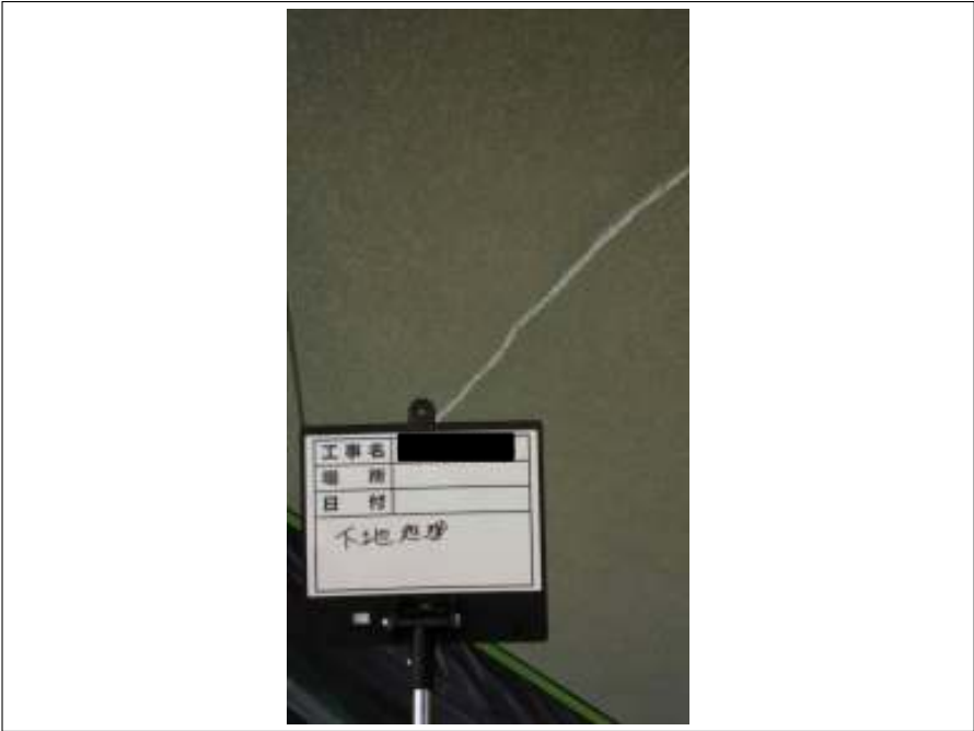
外壁 下地処理施工中