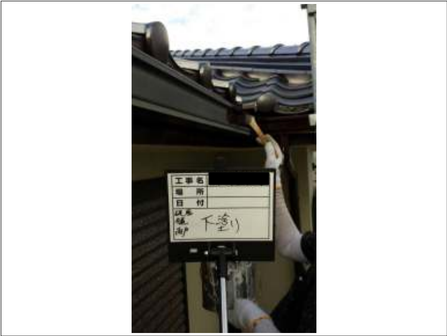
破風・樋 下塗り施工中