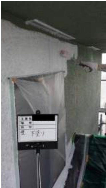
外壁 下塗り施工中