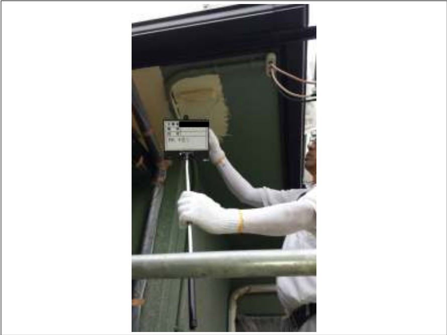
軒天 下塗り施工中