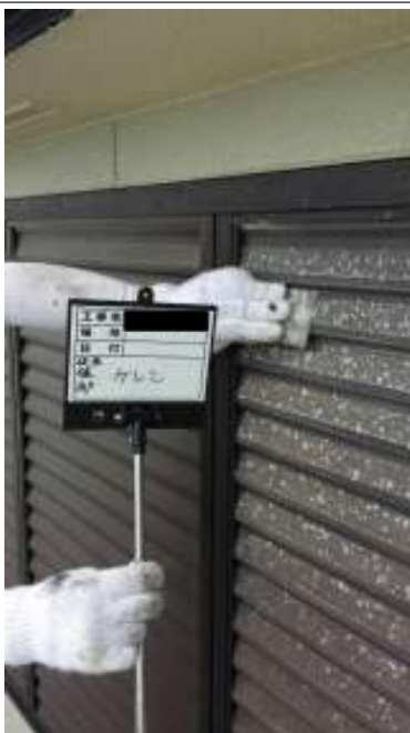
雨戸 ケレン施工中