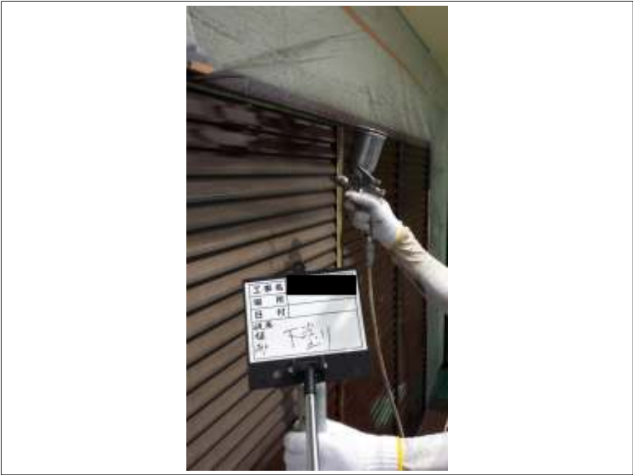
雨戸 下塗り施工中