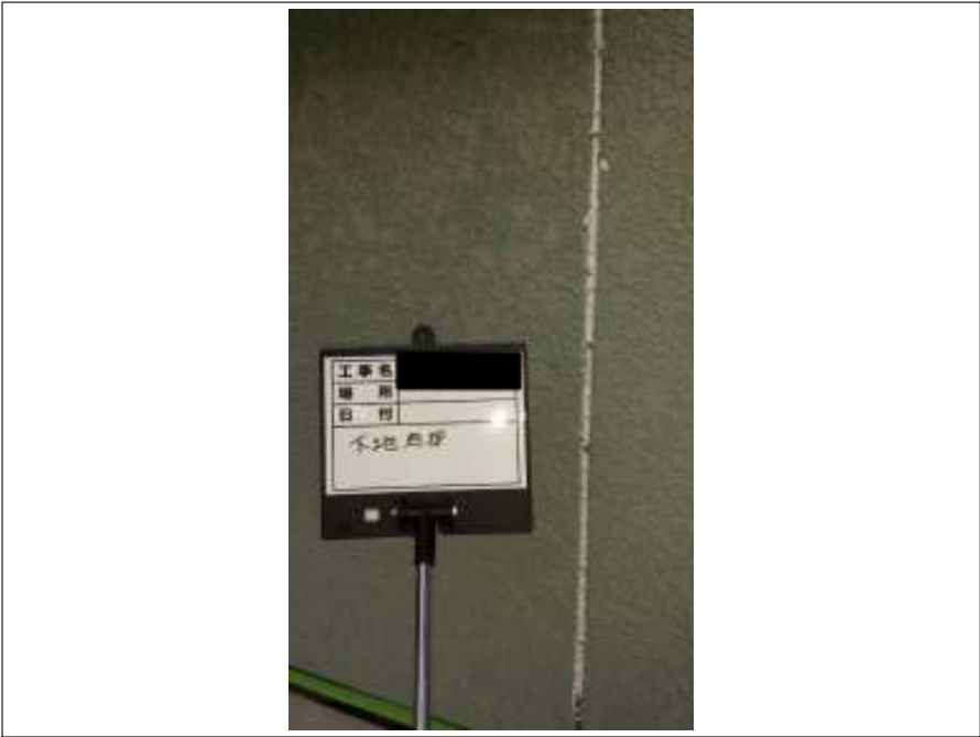
外壁 下地処理施工中