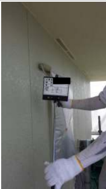
外壁 上塗り施工中