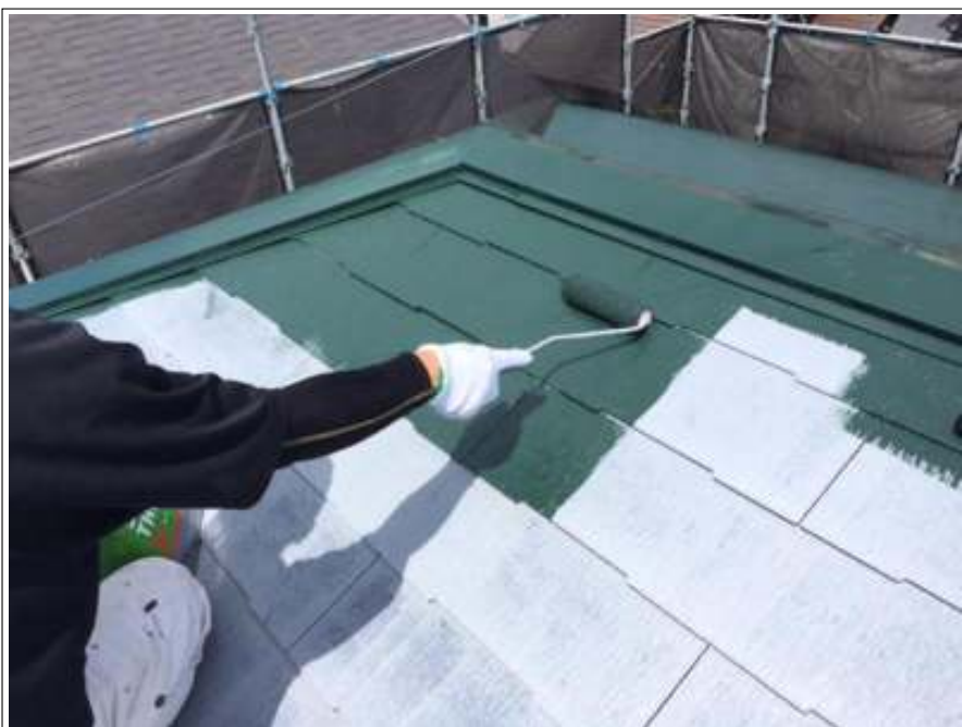
屋根 中塗り施工中