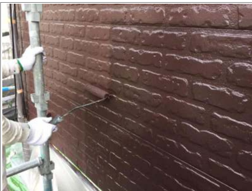
外壁 上塗り施工中