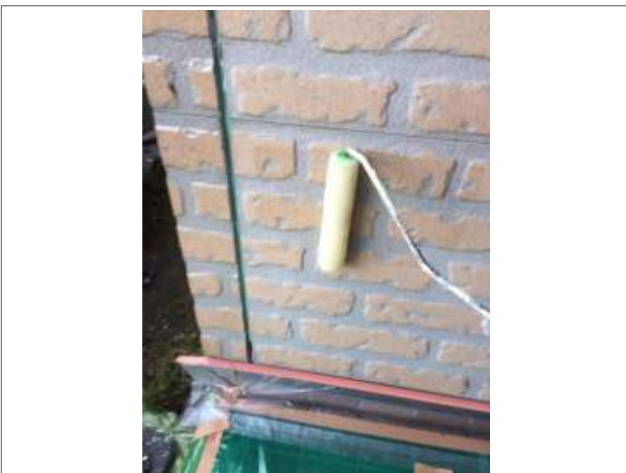
外壁 クリア一部 下塗り施工中