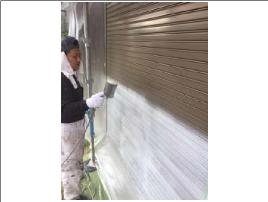
シャッター 上塗り施工中