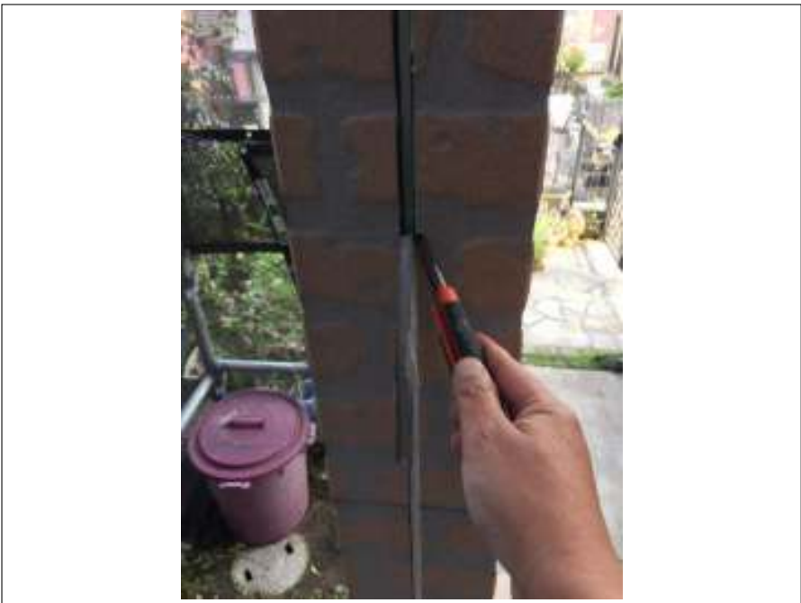
シーリング 既存撤去