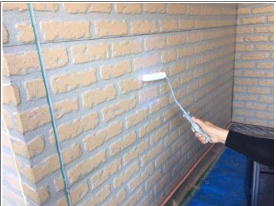
外壁 クリア一部 上塗り施工中