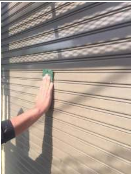
シャッター ケレン処理施工中