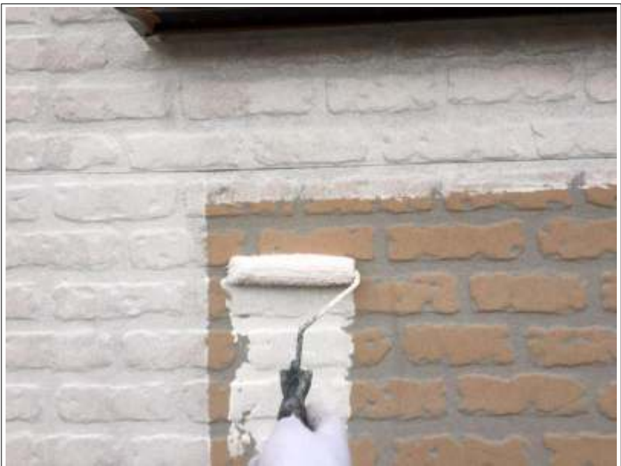
外壁 下塗り施工中