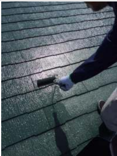
屋根 上塗り施工中