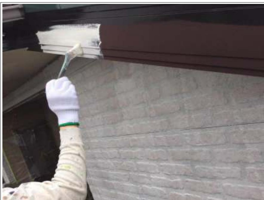
破風板 下塗り施工中