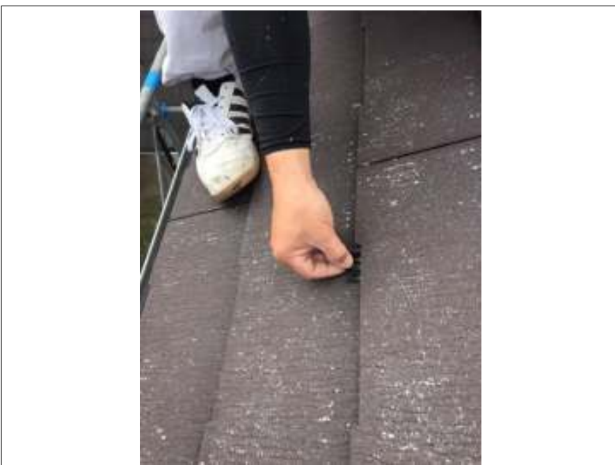
タスペーサー取付 施工中