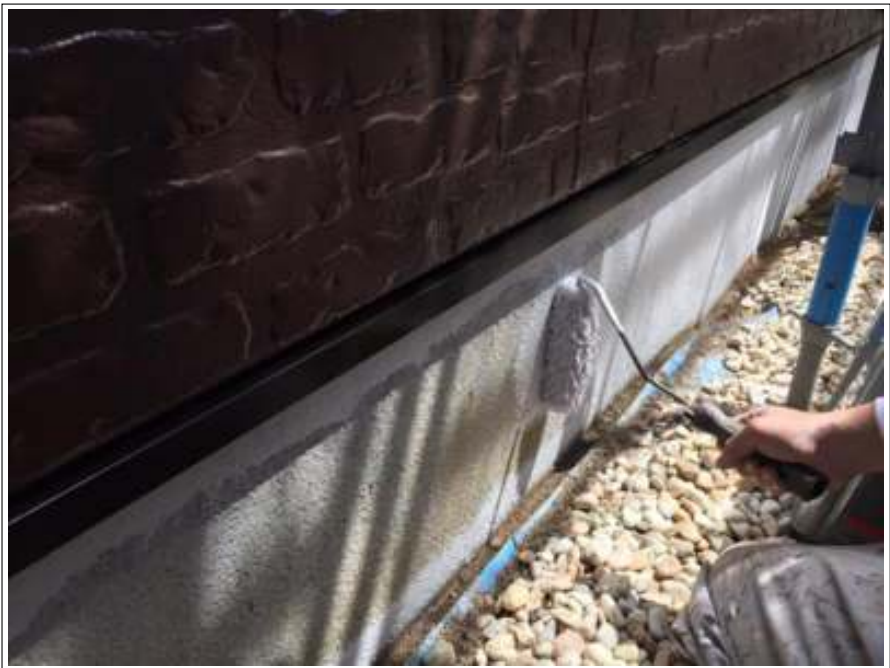
基礎 上塗り施工中