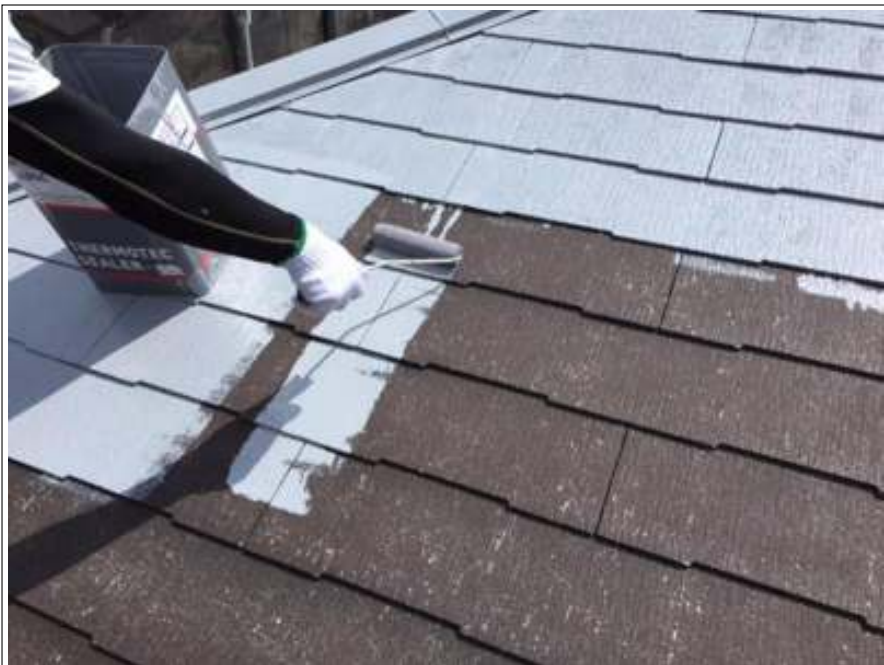
屋根 下塗り施工中