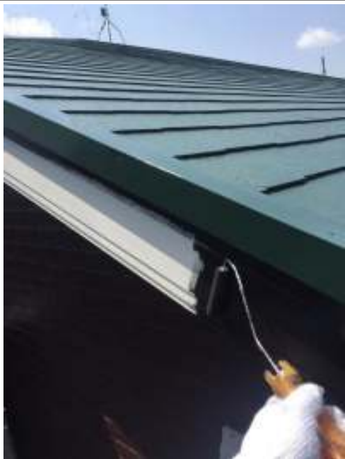
破風板 上塗り施工中