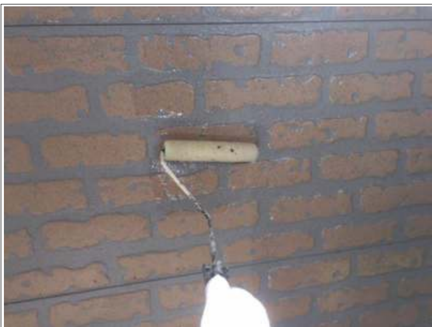
外壁 クリア一部 下塗り施工中