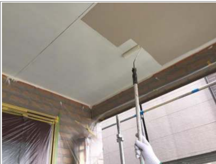
軒天 上塗り施工中