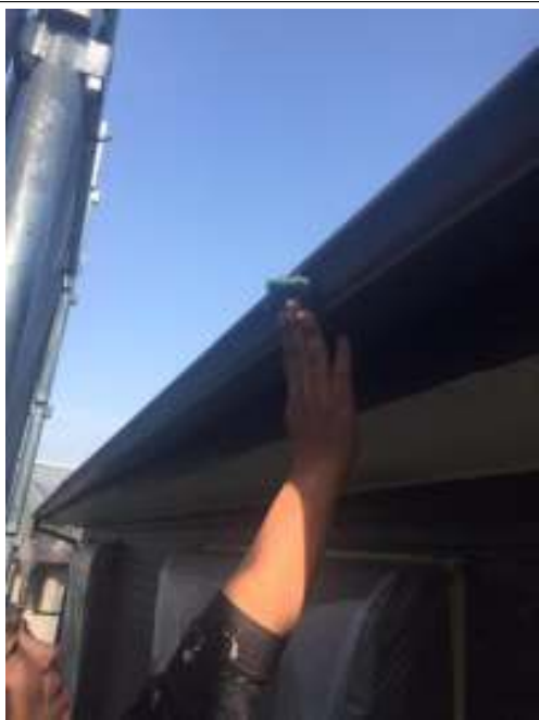
樋 ケレン処理施工中