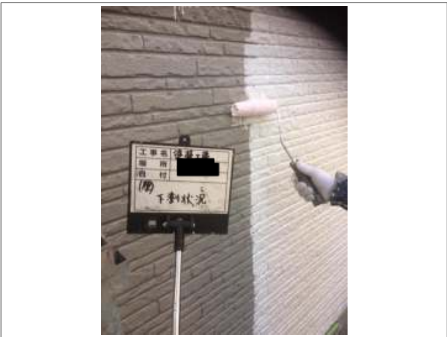
外壁 下塗り施工中