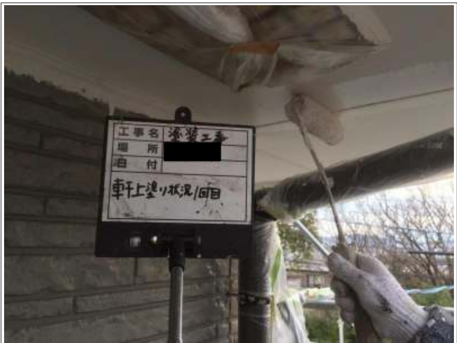
軒天 上塗り（1回目）施工中