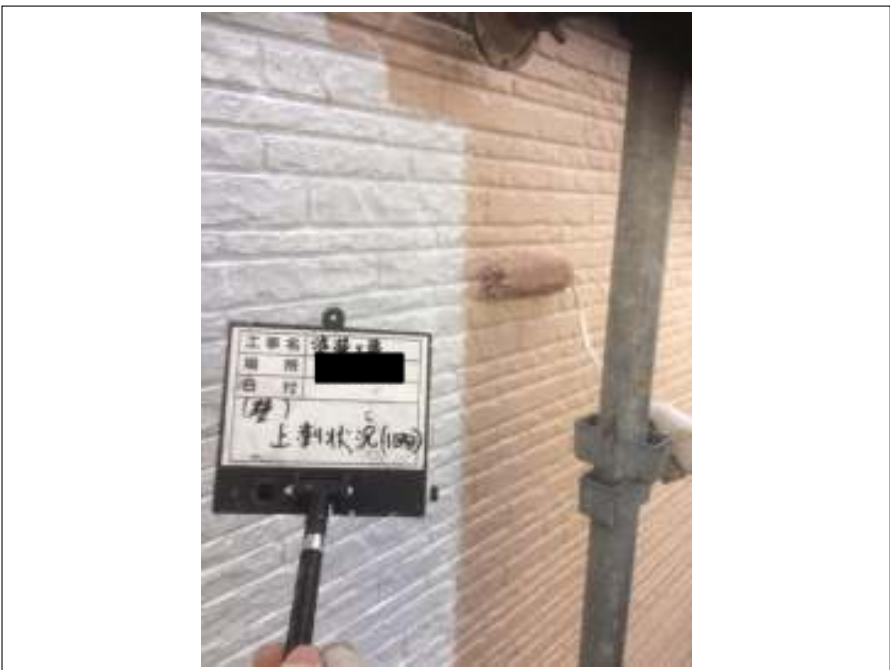
外壁 中塗り施工中