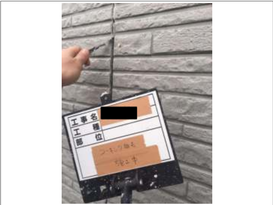
既存シーリング撤去