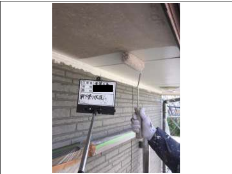
軒天 下塗り施工中