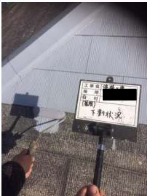
屋根 下塗り施工中