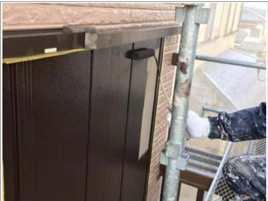
雨戸 上塗り施工中