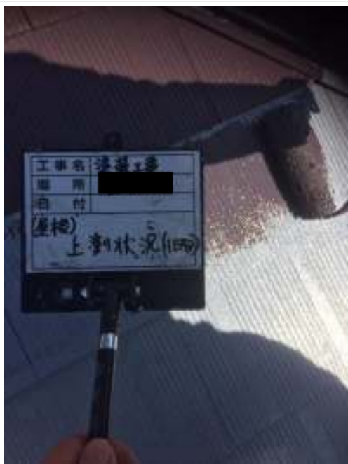
屋根 中塗り施工中