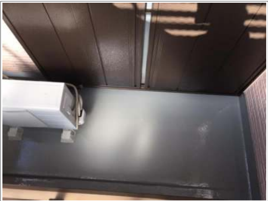
ベランダ防水部 施工後