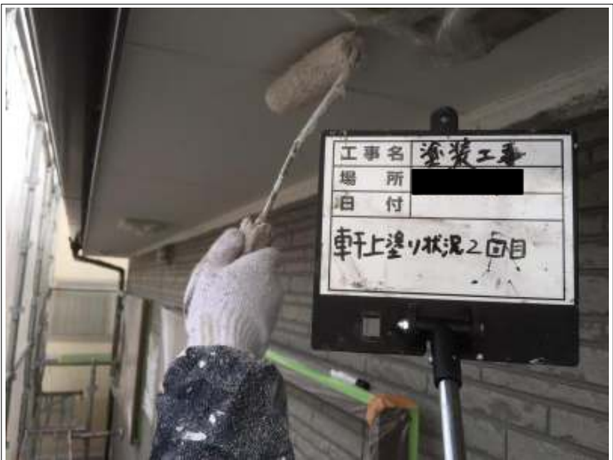
軒天 上塗り（2回目）施工中