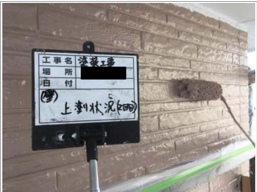
外壁 上塗り施工中