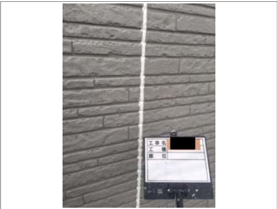
シーリング打ち替え施工後