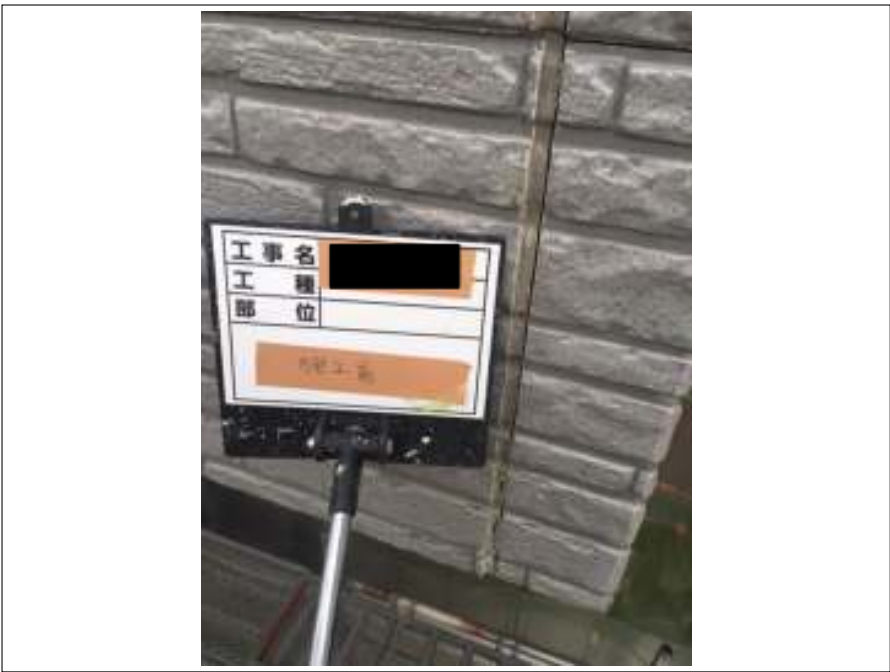
シーリング打ち替え 施工前