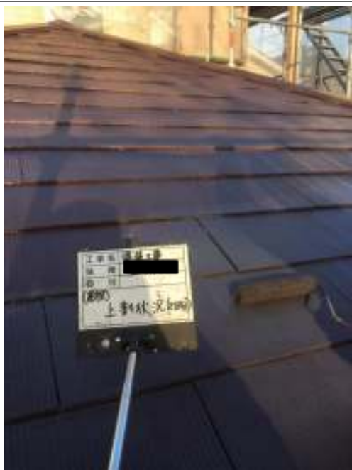
屋根 上塗り施工中